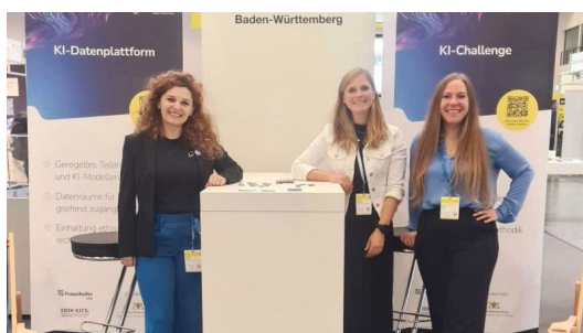
Bild 9: Community Managerinnen der KI-Allianz auf der Quantum Effects Messe