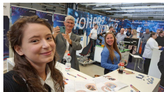
Bild 10: Community Managerinnen der KI-Allianz auf der make Schwäbisch Gmünd