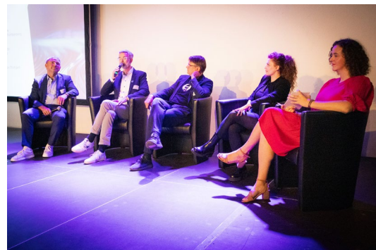
Bild 4: Podiumsdiskussion auf der Auftaktveranstaltung in Stuttgart