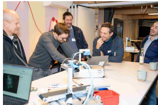
Bild 6: Teilnehmende, die auf der „Digital for Future“ ein Exponat präsentiert bekommen