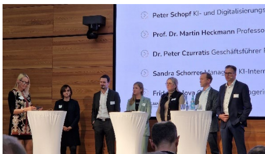
Bild 7: Podiumsdiskussion auf der Auftaktveranstaltung Ostalbkreis