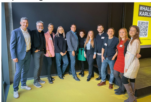
Bild 1: Erstes Gruppenfoto der KI-Allianz mit damaliger Besetzung