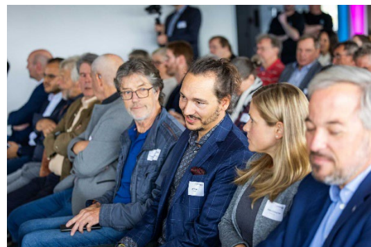
Bild 12: Zwei Community Manager:innen der KI-Allianz im Publikum bei der Eröffnung des AI Experience Room