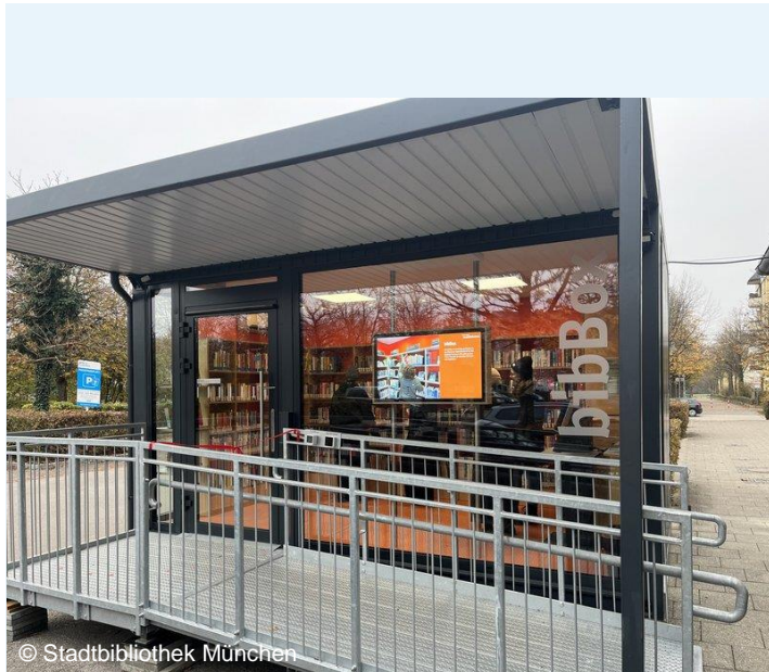
Beispiel der Stadtbibliothek München