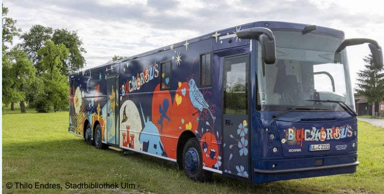
Beispiele anderer Städte, hier der Stadtbibliotheken Köln und Ulm