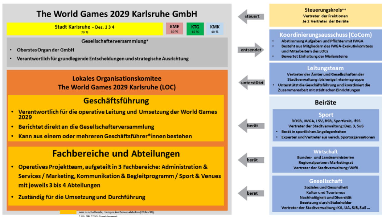
Abbildung: Gremienstruktur TWG 2029

Zwischenzeitlich ist der zweite Regierungsentwurf veröffentlicht, in dem der Förderanteil des Bundes in Höhe von 55 Mio. in voller Höhe hinterlegt ist.