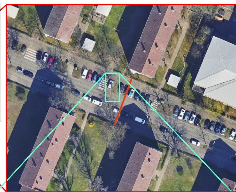
Querschnitt Standort (Haus Nr. 72)