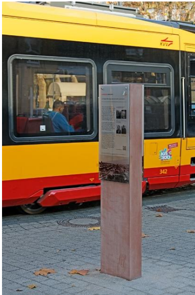
Beispiel: Sandsteinstele zur Erinnerung an die Deportation der Karlsruher Jüdinnen und Juden nach Gurs 1940, aufgestellt beim Hauptbahnhof

Der Leitfaden zur Erinnerungskultur im öffentlichen Raum in Karlsruhe gibt das Format dazu vor als Rote Sandsteinstele mit zwei Glastafeln, auf denen in Text und Bild zu den historischen Ereignissen informiert wird. (siehe Foto einer bereits existierenden Stele als Beispiel).