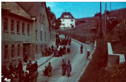
Zur Anschauung hier ein Bild mit ähnlichem Motiv wie für die Stele angedacht, geplant ist jedoch ein Foto mit größerer Menschenmenge bergab vom Hohenasperg (muss beim Bundesarchiv bestellt werden).

Das Format sieht je Tafelseite eine großformatige Abbildung unten vor. Gedacht ist ein Foto aus dem Bundesarchiv, das Sinti und Roma zu Fuß auf dem Weg zum Deportationszug zeigt, nachdem sie auch aus Karlsruhe am 16. Mai 1940 zunächst in Haft auf den Hohenasperg verbracht wurden, um einige Tage darauf in das okkupierte Generalgouvernement gebracht zu werden.