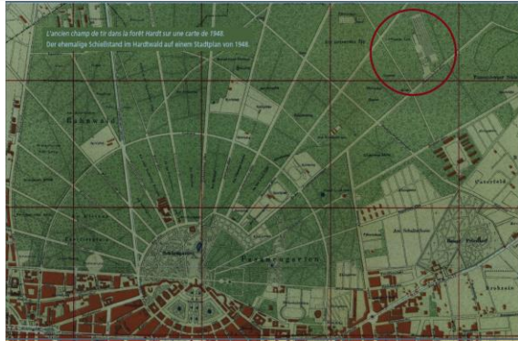
Beispiel: Großformatige Stadtplanabbildung auf der Stele zu Réséaux Alliance, Theodor-Heuß-Allee/Breslauer Straße

Die andere großformatige Abbildung soll als Grundlage einen Katasterplan vom sogenannten „Dörfle“ mit markierten Wohnadressen Karlsruher Sinti und Roma haben, über den ein aktueller Stadtplan mit der völlig veränderten Situation gelegt wird.