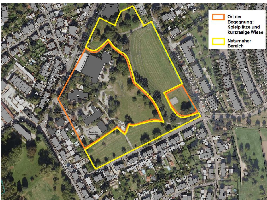
Nutzungskonzept Lustgarten Stand 2024

Das Nutzungskonzept lässt sich wie folgt beschreiben: Der heutige Lustgarten umfasst drei verschiedene Nutzungsbereiche. Vor dem Restaurant befinden sich mehrere Spielplätze und eine kurzgeschorene Grünfläche, die den Bürger*innen als Ort der Begegnung zur Verfügung stehen. Zusätzlich befinden sich im Rückhaltebecken mehrere sportliche Einrichtungen wie z.B. ein Basketballfeld und eine Spielwiese, auf der die Bürgerinnen und Bürger Fuß-, Feder- oder Volleyball spielen können. Somit steht zirka die Hälfte der Flächen des Lustgartens den Bürgerinnen und Bürgern als Erholungs- und Freizeitpark zur Verfügung.