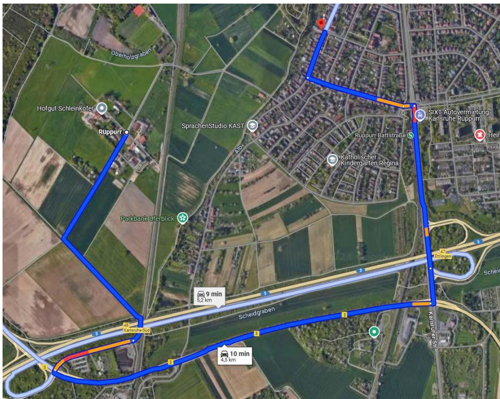
Abbildung 5 - Fahrweg über den BÜ