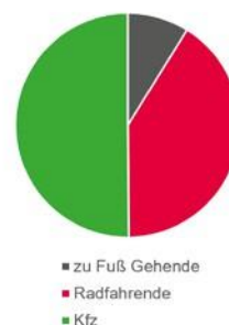
Abbildung 3 – Verkehrszahlen Straßenverkehr am Brunnenstückweg