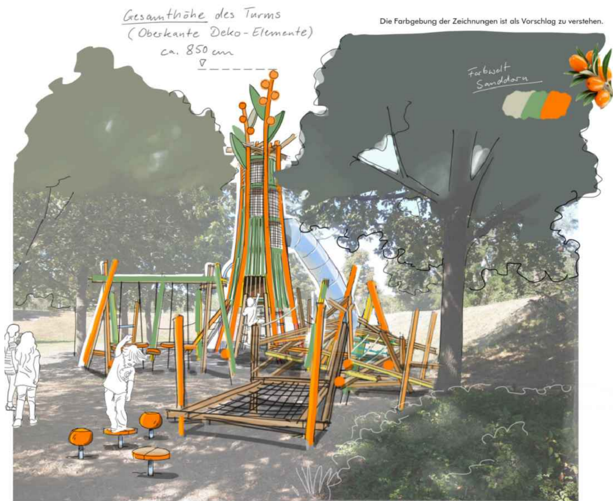
Gesamthöhe des Turms (Oberkante Deko-Elemente) ca. 8,50 m

Die Farbgebung der Zeichnungen ist als Vorschlag zu verstehen.