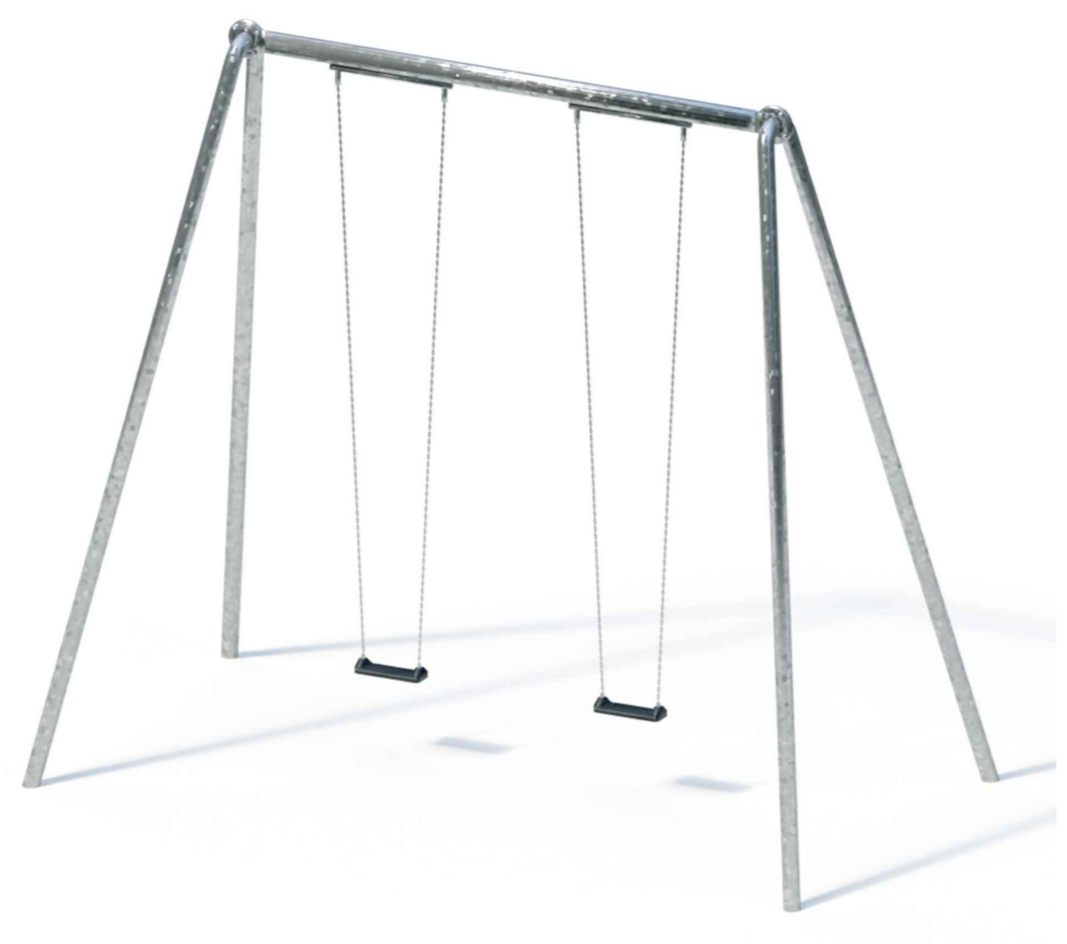
Himmelschaukel Kaiser & Kühne