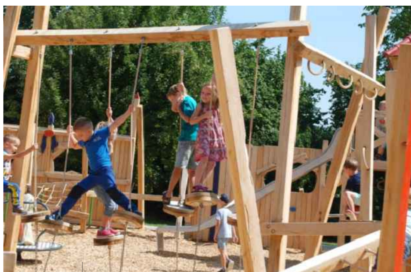
Tellerbalance, Hangelbalken Zimmer.Obst, Spielraumgestaltung