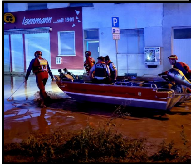
Einsatz im Starkregenereignis Saalbach 2024