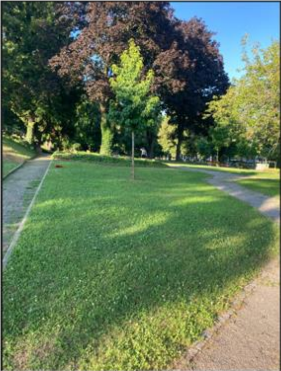
Anlage 4 - Erweiterung Baumanlage