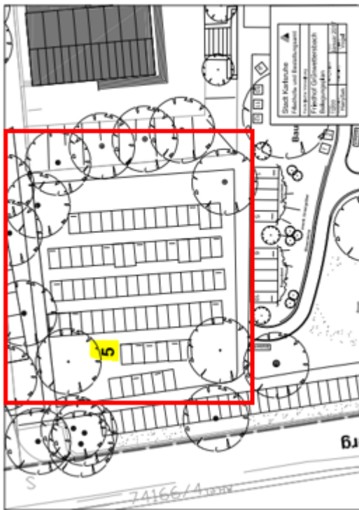
Anlage 1 - Wiesengräber