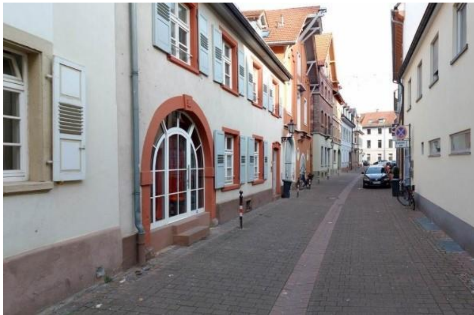
Beispiel Zehntstraße Durlach Zentrum

Die Überplanung des Straßenzuges sieht vor, die schmale, dörflich geprägte Wohnstraße niveaugleich als Mischverkehrsfläche mit einer durchgängigen dunkelroten Pflasterung auszubauen.