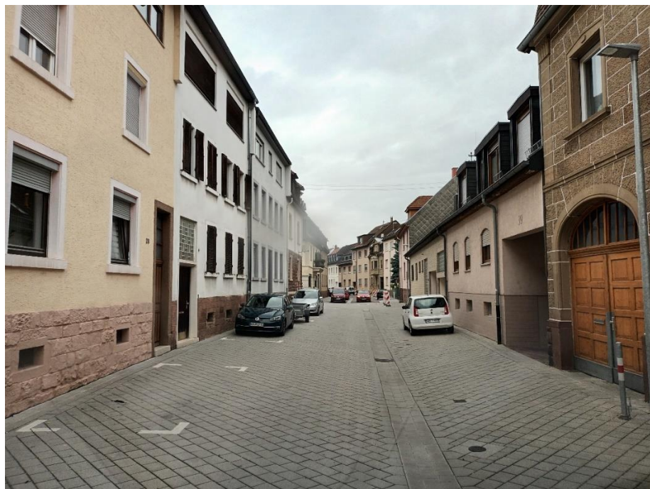
Beispiel Westmarkstraße, Durlach-Aue