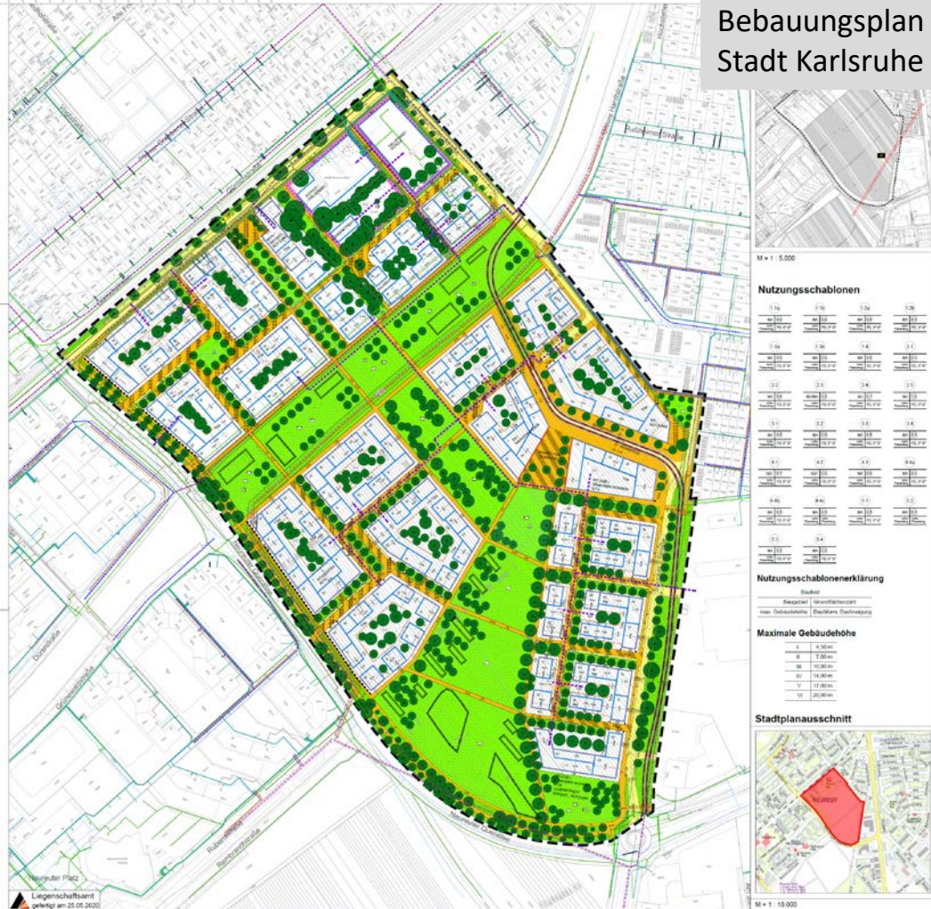
Bebauungsplan Stadt Karlsruhe