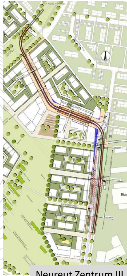
Neureut Zentrum III