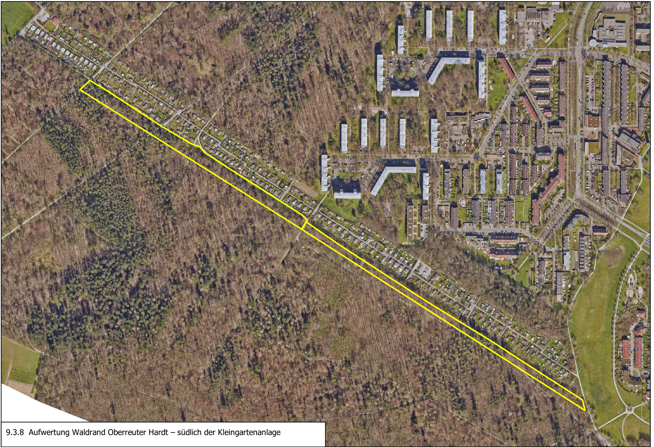
9.3.8 Aufwertung Waldrand Oberreuter Hardt – südlich der Kleingartenanlage