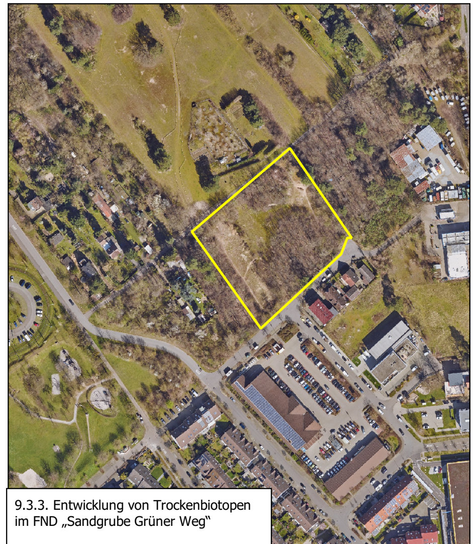
9.3.3. Entwicklung von Trockenbiotopen im FND „Sandgrube Grüner Weg“