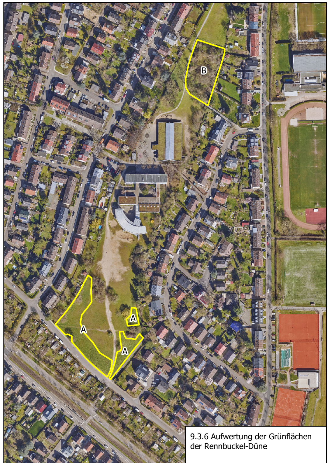
9.3.6 Aufwertung der Grünflächen der Rennbuckel-Düne