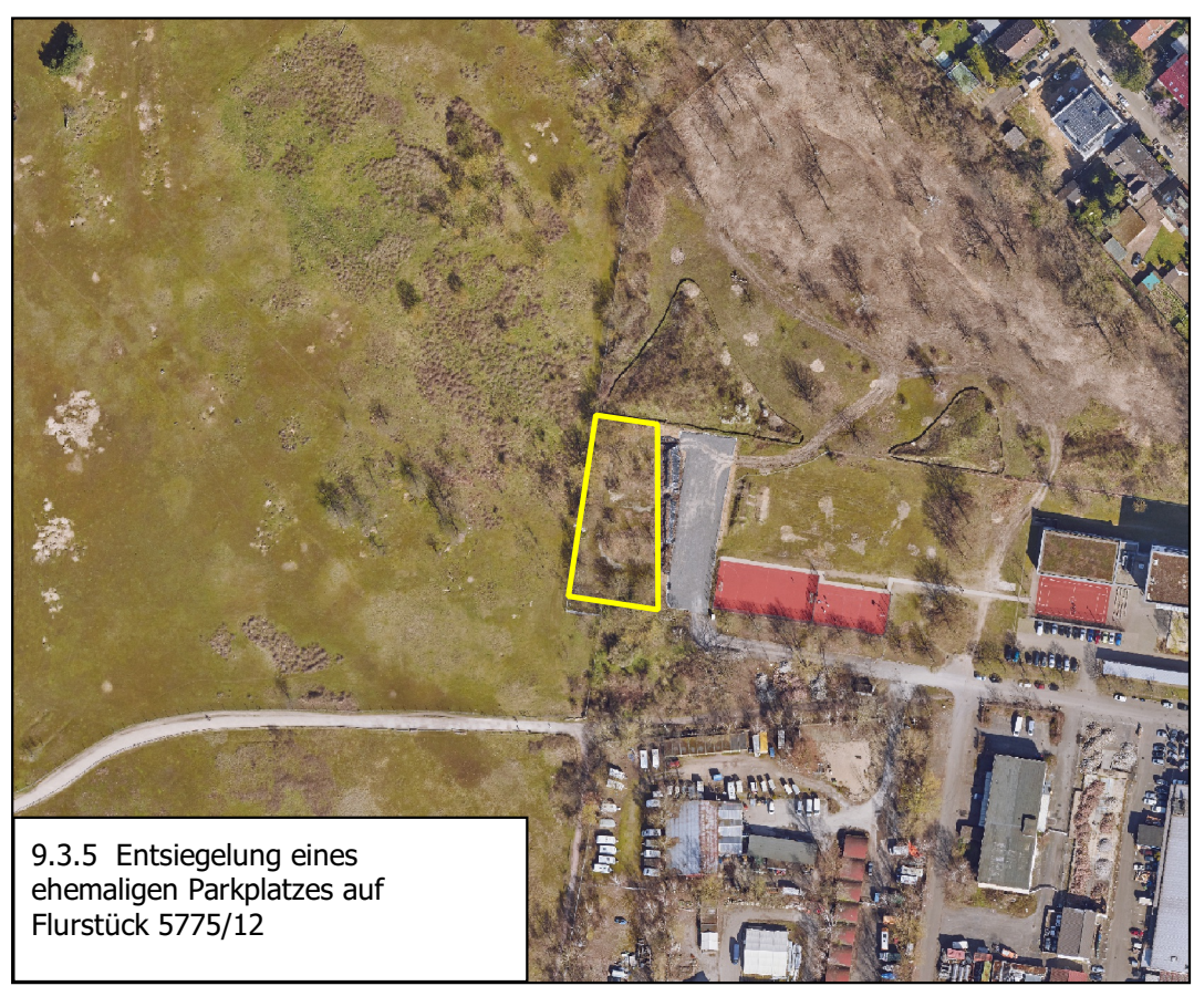
9.3.5 Entsiegelung eines ehemaligen Parkplatzes auf Flurstück 5775/12