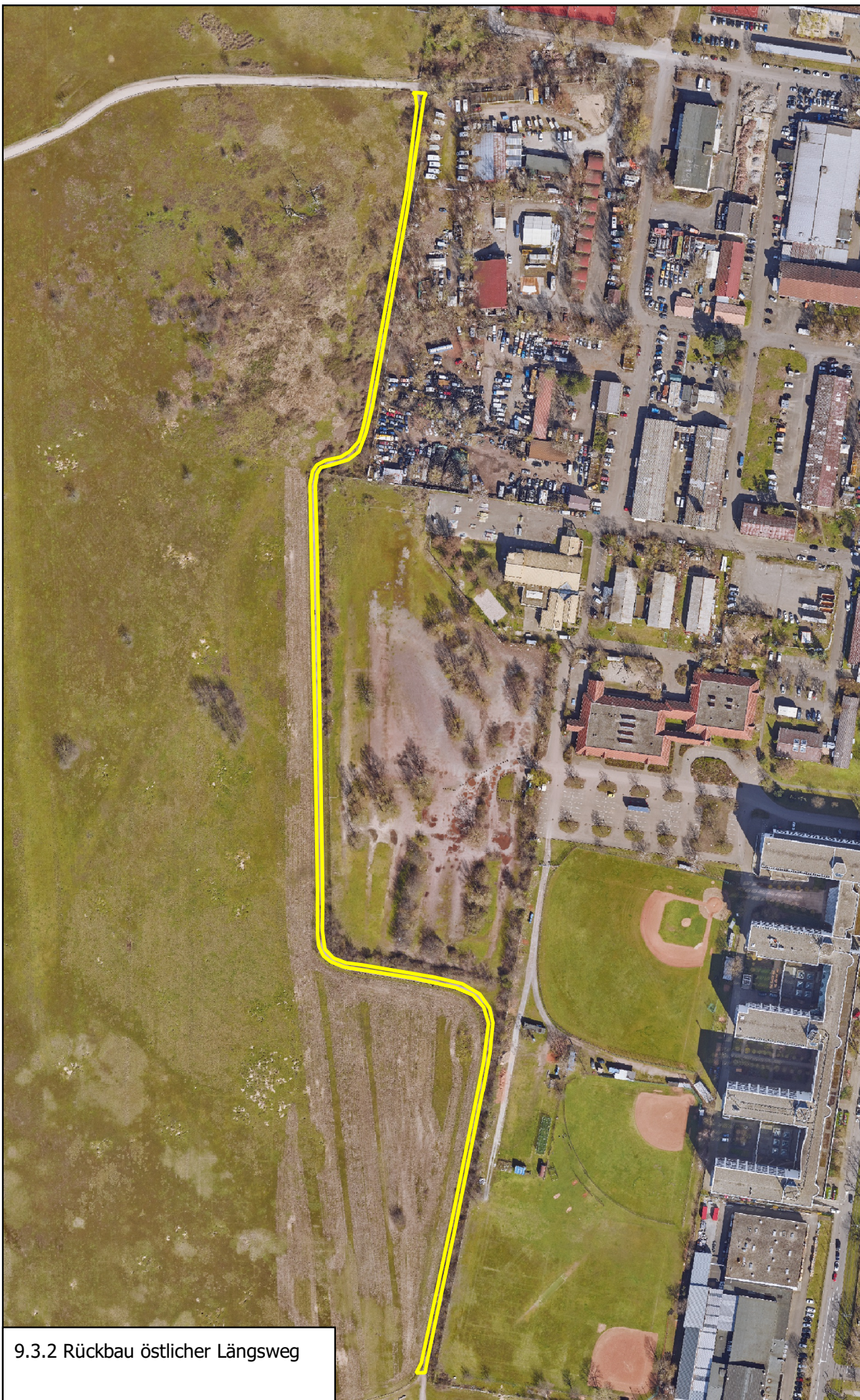
9.3.2 Rückbau östlicher Längsweg