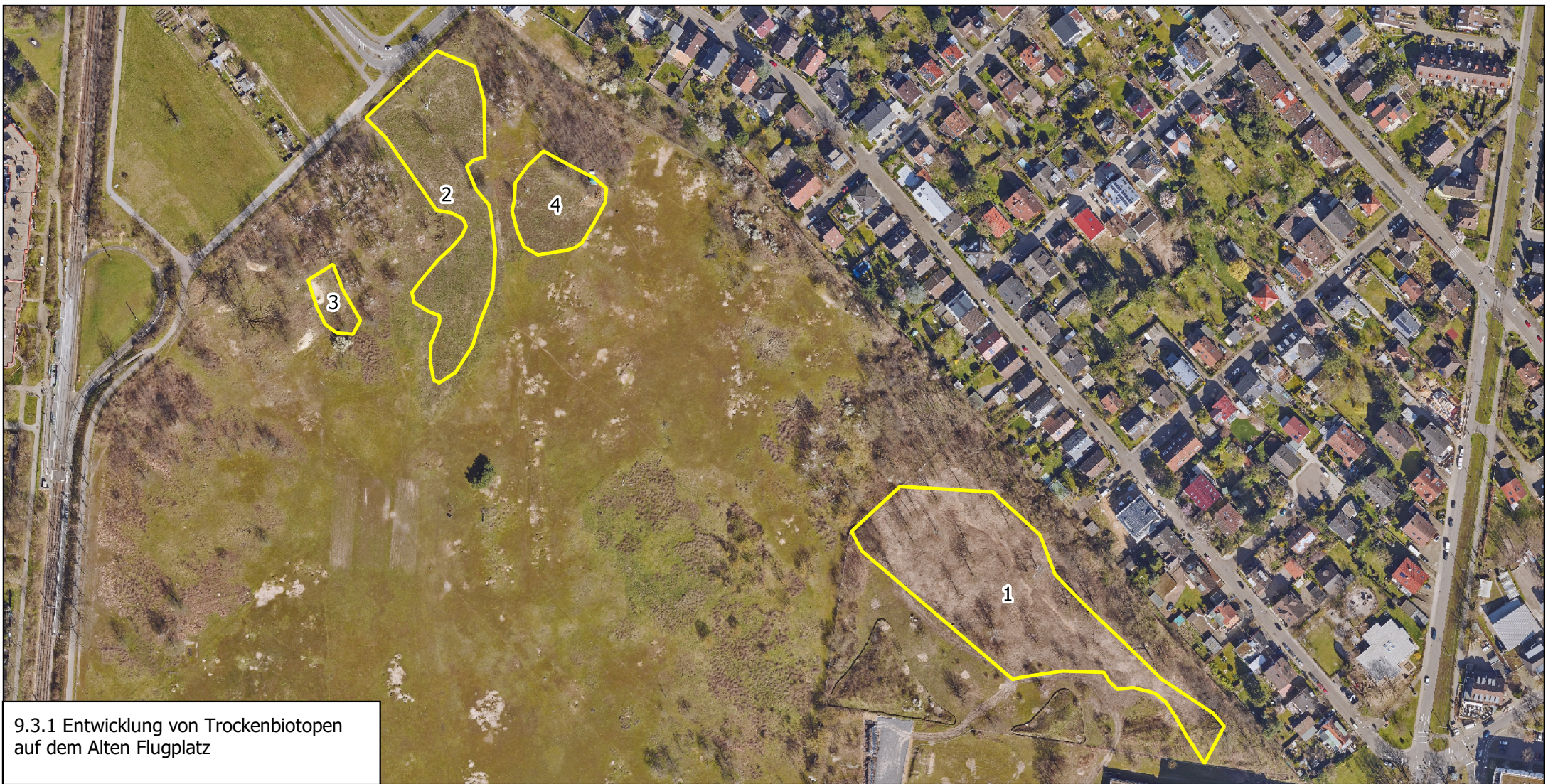
9.3.1 Entwicklung von Trockenbiotopen auf dem Alten Flugplatz