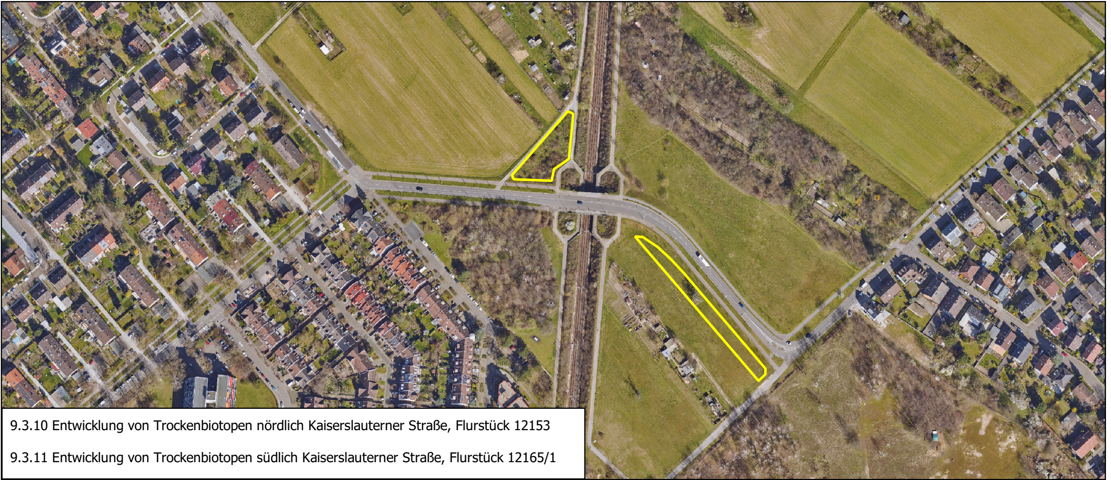
9.3.10 Entwicklung von Trockenbiotopen nördlich Kaiserslauterner Straße, Flurstück 12153 9.3.11 Entwicklung von Trockenbiotopen südlich Kaiserslauterner Straße, Flurstück 12165/1