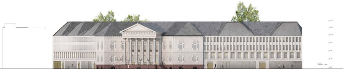
ANSICHT KARL-FRIEDRICH-STRASSE 1:200