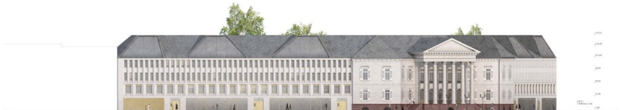
ANSICHT MARKGRAFENSTRASSE 1:200