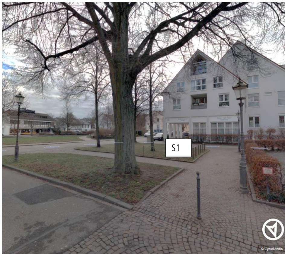
Abbildung 1 Standort-Alternative S1 Grünfläche zwischen Niddaplatz und Begegnungsstätte

Bei Alternative S2 befände sich der Tisch zusammen mit den Bänken unter schattigem Baumbewuchs, was einer Nutzung gerade im Hochsommer entgegenkäme. Hinzu kommt, dass die an diesem Ort angesiedelten Gruppe des „Urban Gardening“ den Tisch als Treffpunkt-Möglichkeit mitnutzen könnten.