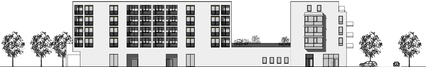
Ansicht West - Bernhard-Lichtenberg-Straße