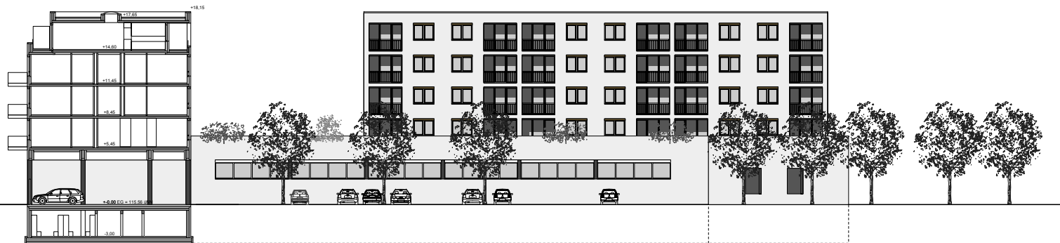
Schnitt Achse 16 BT Wilhelm-Leuschner-Straße