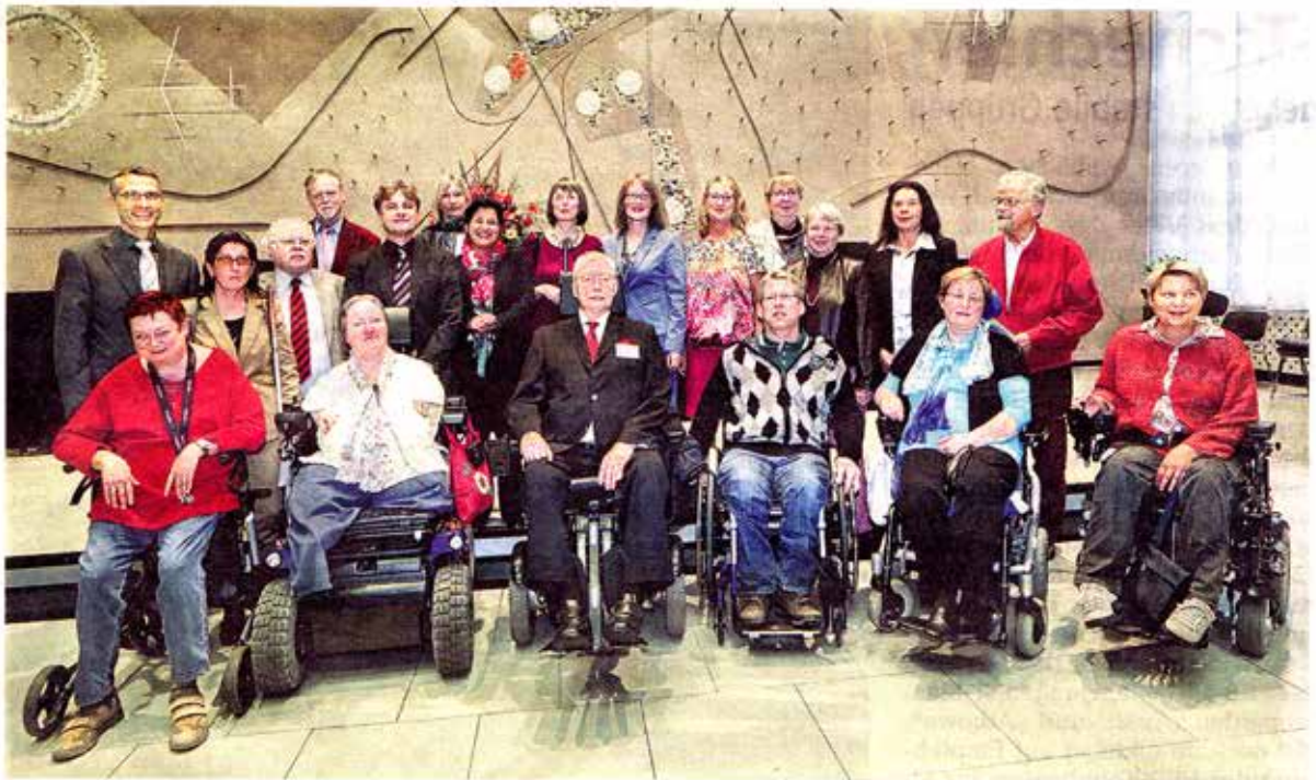
GRUPPENBILD IN ALTER BESETZUNG: Am 8. November wird der Beirat für Menschen mit Behinderungen für fünf Jahre neu gewählt. Erstmals können dann auch Einzelbewerber antreten.

aufgeregt“ hätten die Pioniere in eigener Sache „Herzen und Köpfe erreicht“ und „Karlsruhe verändert“. „Davon profitieren wir alle, davon profitiert das Miteinander“, dankte Mentrup. Als „wichtigen Impulsgeber“ eines breiten gesellschaftlichen Dialogs bezeichnete Katrin Altpeter, Landesministerin für Arbeit und Sozialordnung, Familie, Frauen und Senioren, die ehrenamtlich tätige Interessenvertretung. Gemäß der seit 2008 gültigen UN-Konvention werfe der Beirat einen „allumfassenden Blick auf das Zusammenleben“ und stelle in allen Lebensbereichen Fragen nach „Hürden und Hindernissen.“ -maf-