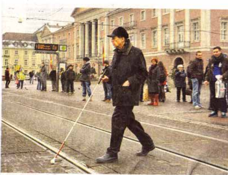
GLEICHBERECHTIGTES MITEINANDER: Der Behindertenbeirat vertritt die Interessen von Menschen mit Handicap.