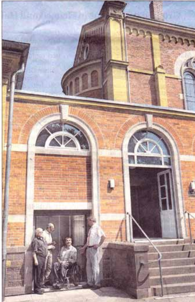
EIN AUFZUG ermöglicht jetzt Rollstuhlfahrern und Gehbehinderten den Zugang zur großen Kapelle im Hauptfriedhof.