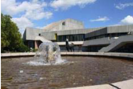
Das Badische Staatstheater

19.03.2013 01:45 Karlsruhe (ps/ts) - In der letzten Sitzung des Behindertenbeirats (BMB) der Stadt Karlsruhe wurde unter anderem die Situation arbeitsloser Schwerbehinderter diskutiert. Weitere Themen waren die Barrierefreiheit im Badischen Staatstheater und im Karlsruher Zoo.