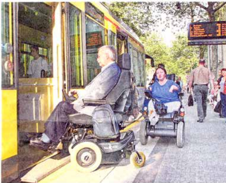
AN VIELEN HALTESTELLEN können Rolli-Fahrer ebenerdig in die Bahn gelangen. Das ist mit ein Verdienst des Behindertenbeirats.

So fordern die jetzigen Kämpferinnen und Kämpfer in eigener Sache weitere barrierefreie Maßnahmen im Hauptbahnhof, bei den Verkehrsbetrieben, im Staatstheater und den Geschäften in der Innenstadt. Außerdem brauche es mehr barrierefreien Wohnraum sowie inklusive Bildung von Kindern in Kitas und Schulen. -maf-