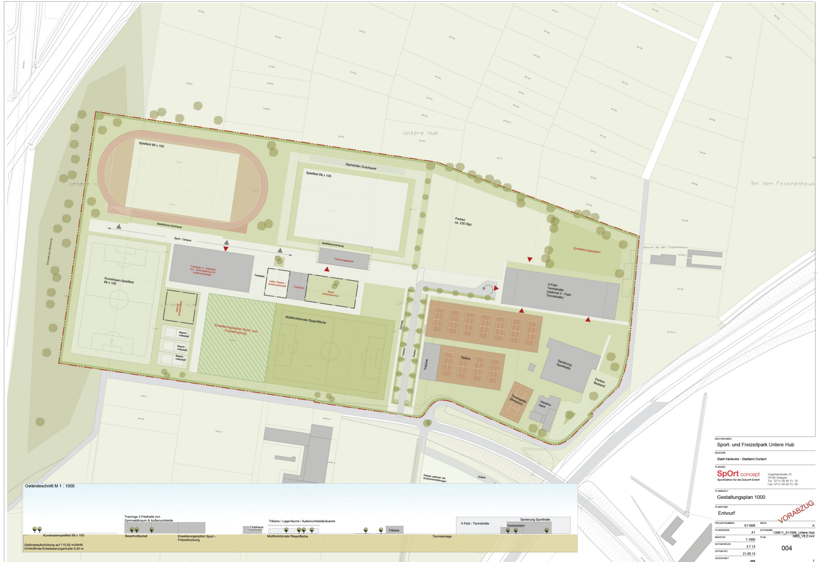
Geländeschnitt M 1 : 1000