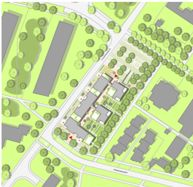
Entwurf Büro evaplan