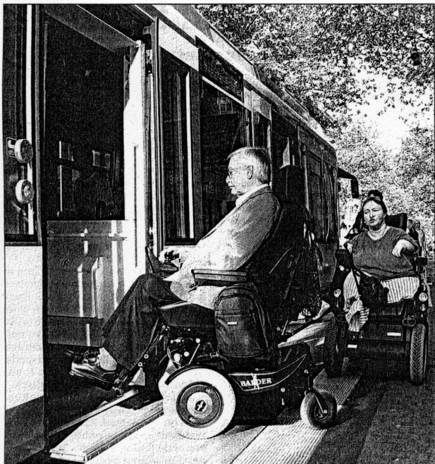
EINE WOHLTAT NICHT NUR FÜR MENSCHEN IM ROLLSTUHL ist die barriere Umgestaltung der Straßenbahnhaltestelle in der Herrenstraße.