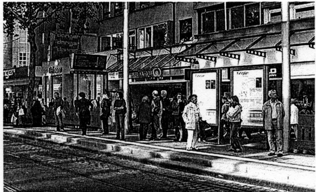
Auch die Geschäfte in Karlsruhe sollen barrierefrei werden

Der Gemeinderat der Stadt Karlsruhe hatte die Erstellung eines Katalogs erforderlicher Standards im Oktober beschlossen. Hintergrund ist ein im Masterplan festgeschriebenes Ziel: Bis zum 300. Stadtgeburtstag sollen alle öffentlichen Gebäude barrierefrei sein. Nach dem aktuellen Beschluss müssen Gebäude und Einrichtungen immer folgende fünf Grundkriterien erfüllen: stufenloser Zugang, ausreichend breite Türen, ausreichend große Bewegungsflächen, Markierung von gefährlichen Glastüren und Stufen, Orientierungsmöglichkeiten für seh- und hörbehinderte Menschen.