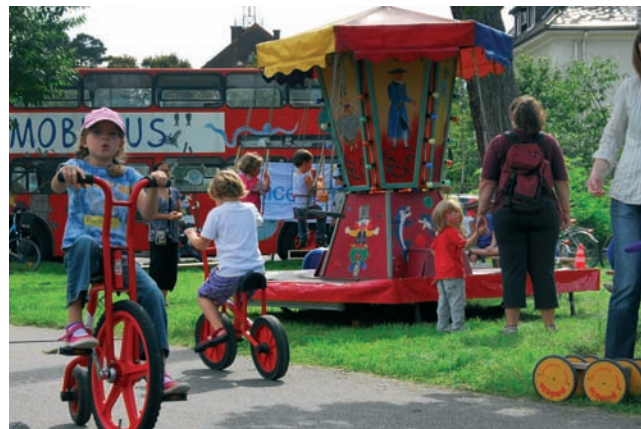
UNICEF - Mobile Spieleaktion