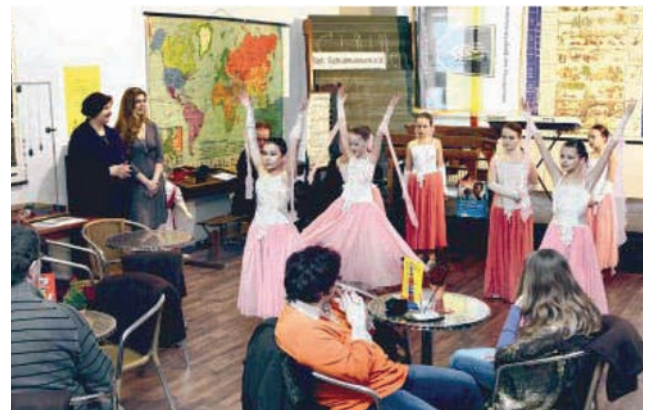
Nachwuchs der Landsmannschaft der Deutschen aus Russland bei einem Auftritt im Schulmuseum Karlsruhe.

Kinder und Jugendliche der Landsmannschaft der Deutschen aus Russland sammeln mit Auftritten Spenden für die Erdbebenopfer in Haiti. Die nötigste Versorgung mit Wasser und Nahrungsmitteln, Impfungen und die „Schule aus der Kiste“ werden damit unterstützt.