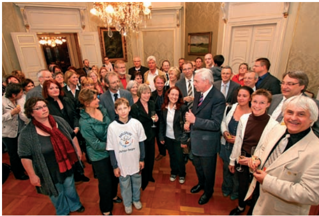
UNICEF-Tag der Arbeit, Haus Solms