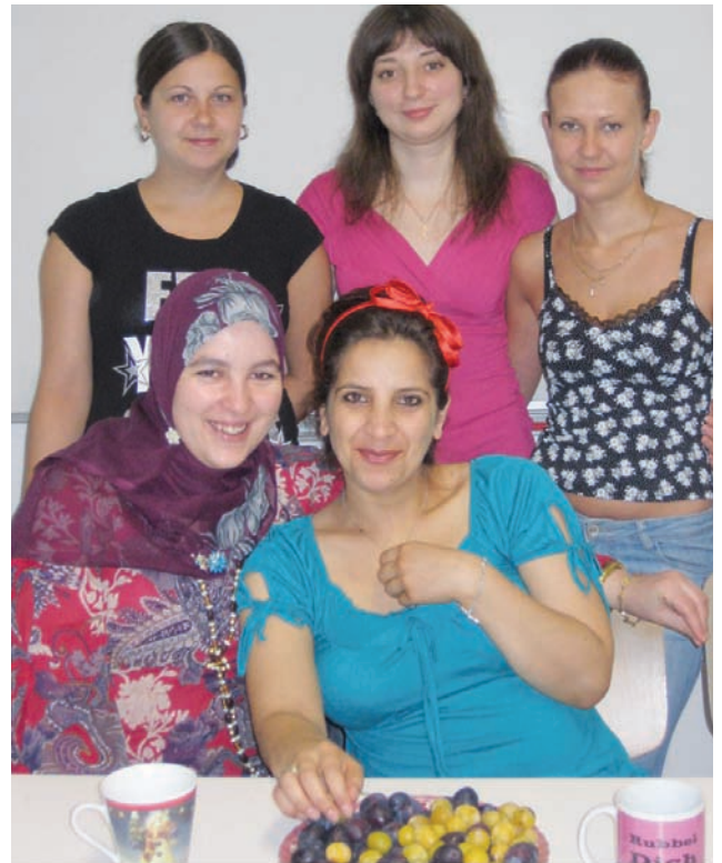
Internationale Teestube für junge Frauen

In Karlsruhe leben Frauen aus allen Kontinenten und mehr als 140 Ländern. In den Räumen der Ausstellung „Gastarbeiter in Deutschland – Zuwanderung nach Karlsruhe“ wurde jungen Frauen die Möglich-