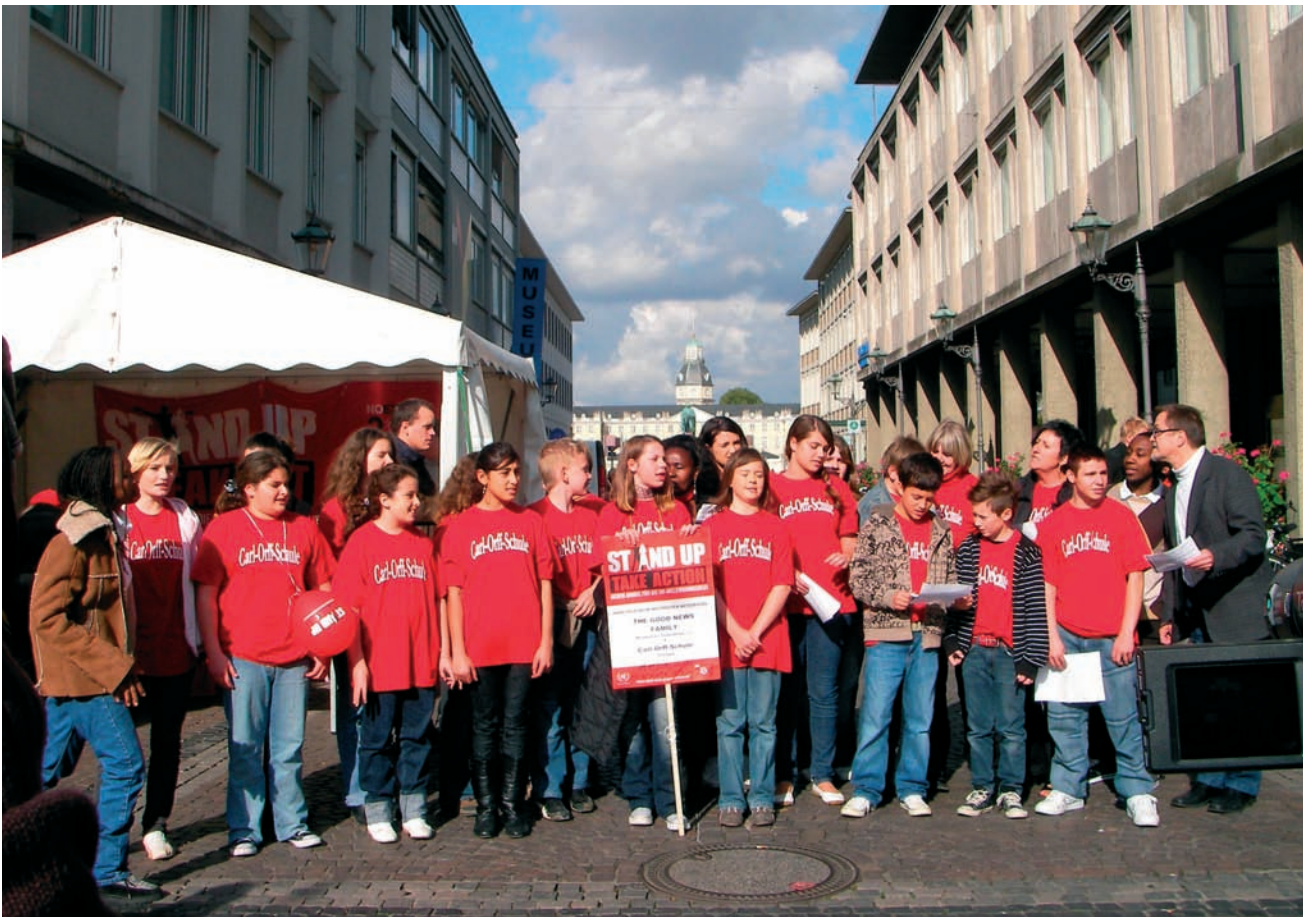
Stand Up-Aktion in der Karlsruher City