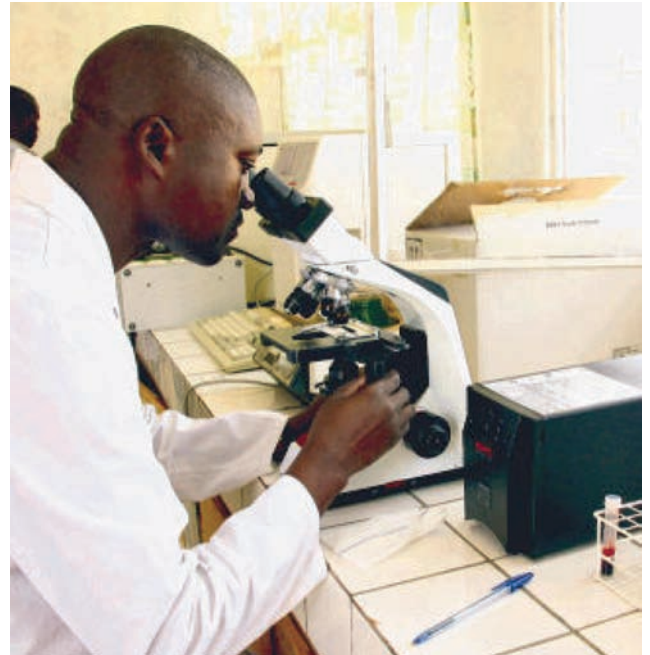
Labor wurde mit Hilfe aus Deutschland eingerichtet.

Die Medizinstation des Schul- und Ausbildungszentrums „Ecole Polyvalente Carolus Magnus“ in Burundi, in der Kranke aus großem Umkreis behandelt werden, wurde 2010 zum „Hippokrates-Krankenhaus“ ausgebaut. Möglich wurde dieser Ausbau dank der Unterstützung durch das Städtische Klinikum Karlsruhe gGmbH, das Klinikbetten mit Matratzen und Beistelltischen zur Verfügung stellte, sowie durch die Unterstützung durch Ärztinnen und Ärzte des Landkreises, die medizinisches Gerät besorgten.