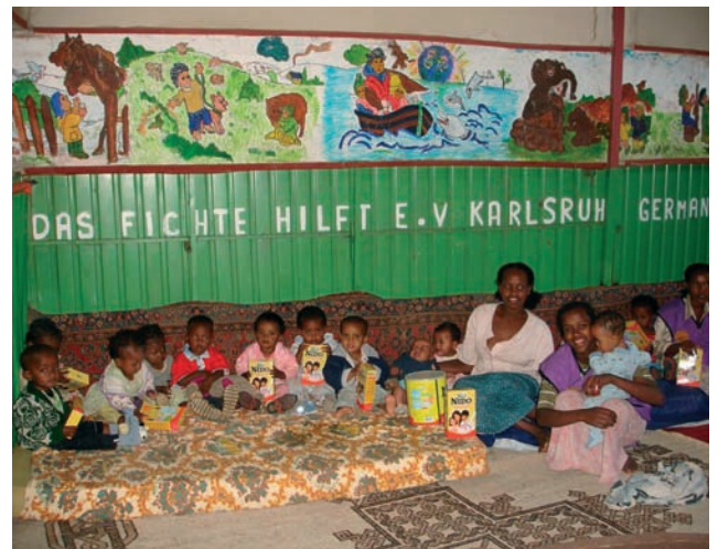
Wohncontainer in Addis Abeba

Wer eine menschliche Welt erwünscht, darf seine eigene Fähigkeit, mit anderen mitzufühlen, nicht verkümmern lassen. Empathie ist Voraussetzung für die Sympathie (griech.: mitleiden), dem Mitfühlen und dem Mitleiden, auch gerade mit Menschen, die sich selbst nicht mehr zu helfen wissen. Aus mitfühlender Anteilnahme entsteht der Wunsch, durch Helfen das Leid des anderen zu verringern.