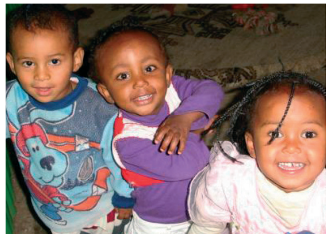
Kinder im Projekt GODANAW