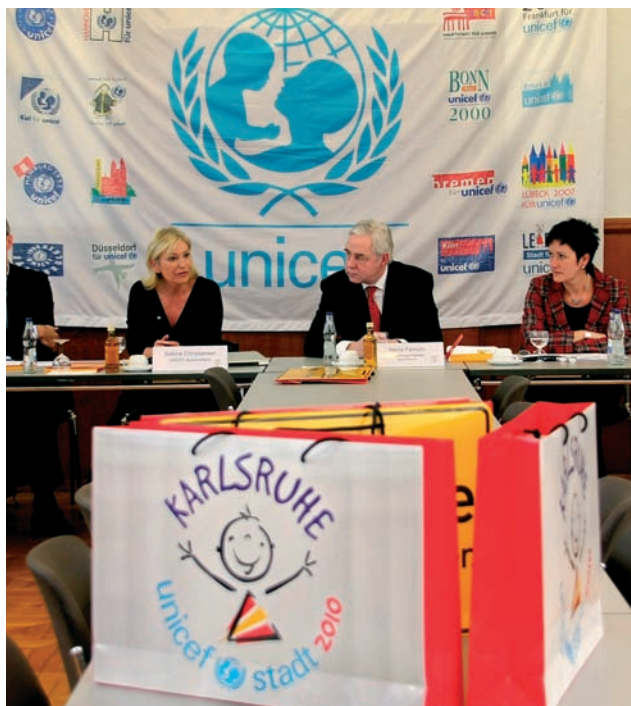
UNICEF - Stadt Karlsruhe 2010, Taschen

Jährliche African Summer Night; Ghanafest 2010 der Ghana-Union Karlsruhe und des Dachverbandes ghanaischer Vereine in Deutschland; Anerkennungspreis „Miteinander leben“; Chinesisches Frühlingfest mit Studierenden und Wissenschaftlerinnen/Wissenschaftlern; Veranstaltungsreihe „Mit gemeinsamen Werten Grenzen überwinden“ des Tunesischen Clubs Karthago und anderer Vereine; Afrika-Tag des Tollhauses beim Zeltival; Hip-Hop-Kulturzentrum Combo e. V., Farbschall e. V.; Türkische Tage im Schloss der Deutsch-Türkischen Kulturplattform; Lange Nacht der Deutsch-Türken des Türkischen Elternvereins und des Türkischen Frauenvereins; Deutsch-Kroatische Gemeinschaft; Nakba-Ausstellung; Grönland-Filmfestival der Europäischen Schule im ZKM; Internationaler Mittelmeer-Kreis e. V.: Lesereihe 2009 – Autoren mit Migrationshintergrund „Nahe Ferne – ferne Nähe“ und Soirée zu interkulturellen Themen wie mediterrane Tischkultur; Jugendverein für Sport und Internationale Freundschaft e. V.: Theater der türkischen Company Hamburg; Centre Culturel Franco-Allemand Karlsruhe: Französische Woche, Vortrag Gisèle Halimi, Französin tunesischer Abstammung, über Kampf gegen Ungerechtigkeit und Diskriminierung; Forum Polnischer Kultur Polonia e. V.; AG der Deutsch-Ausländischen Kulturgesellschaften: jährlich „Europäischer Abend“ in der Karlsburg, Deutsch-Indische Gesellschaft e. V.; Deutsch-Pakistanische Gesellschaft Karlsruhe e. V.