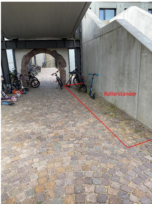
Abbildung 3 Rollerstände Fußgängerbrücke Augustenburgstraße

3. Haltestelle Oberausstraße: östlich der Haltestelle auf der Freifläche könnten Fahrradstände aufgestellt werden. Hier wäre - je nach Beschluss - noch eine Abstimmung mit den Verkehrsbetrieben Karlsruhe hinsichtlich deren „Bike&Ride“-Konzept notwendig.