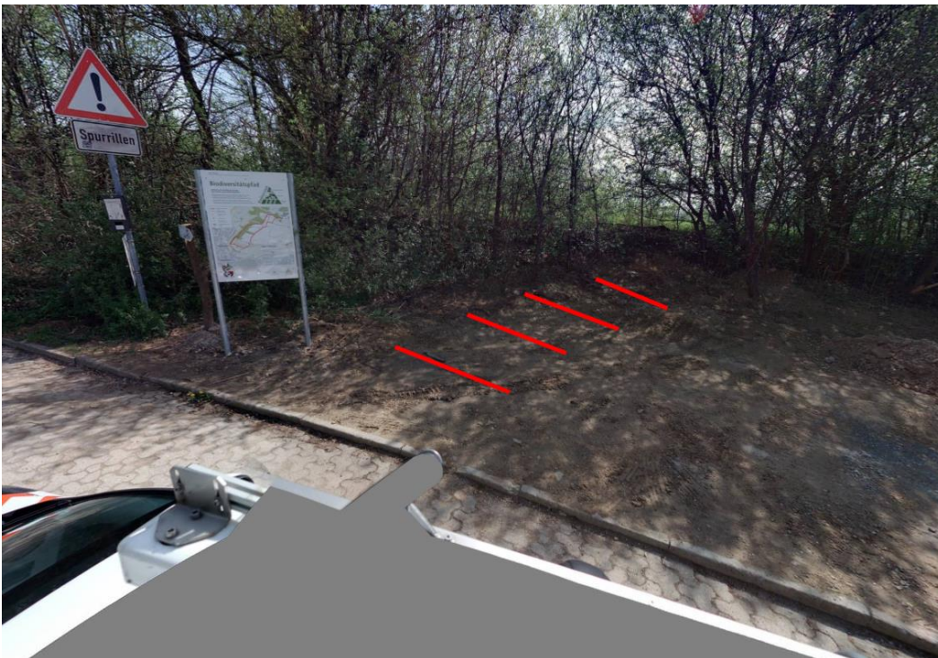
Abbildung 1 Biodiversitätspfad