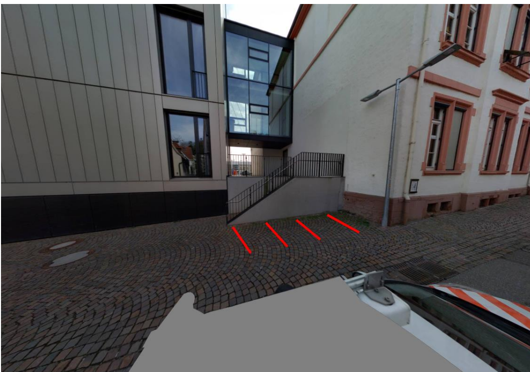
Abbildung 2 Kirchstraße