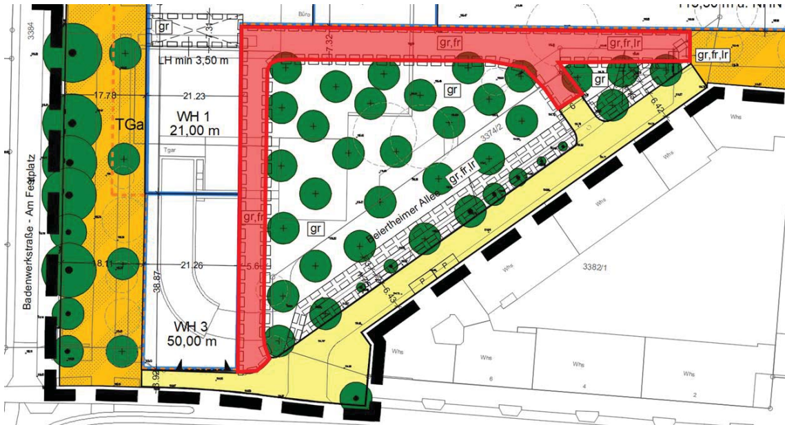
Abb. 4: Fahrrecht Umfahrung „Grüne Mitte“ (Darstellung in rot)

Für die Umfahrung der „Grünen Mitte“ wird ein Fahrrecht zugunsten von Rettungsdiensten und technischen Dienstleistern festgesetzt. Das festgesetzte Fahrrecht umfasst den in nachfolgender Abbildung dargestellten Bereich.