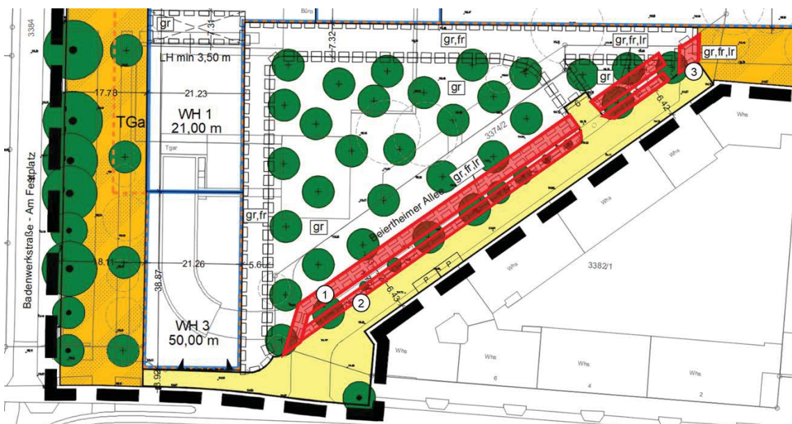
Abb. 5: Geh-, Fahr- und Leitungsrechte (Darstellung in rot)

und sind nachfolgender Abbildung zu entnehmen.