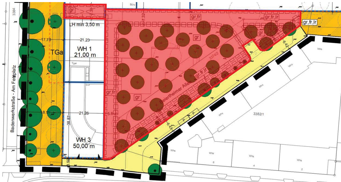
Abb. 3: Gehrecht „Grüne Mitte“ (Darstellung in rot)

Für die öffentliche zugängliche „Grüne Mitte“ und den Durchgang zwischen „Grüner Mitte“ und Badenwerkstraße wird ein Gehrecht zugunsten der Allgemeinheit festgesetzt. Das festgesetzte Gehrecht umfasst den in nachfolgender Abbildung dargestellten Bereich.