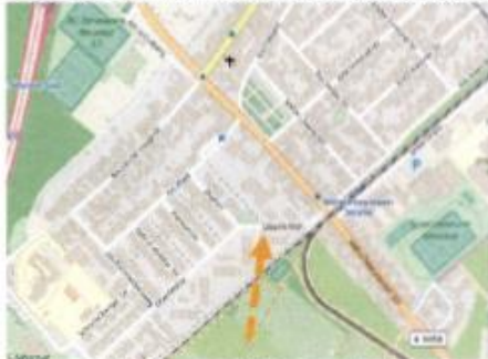
Abbildung 1: Auflösung zur Einordnung der Lokation

hiermit stellt die CDU Fraktion den Antrag die Feuerwehrezufahrt zur Kindertagesstätte Oberfeld und zur Südschule deutlicher zu kennzeichnen.