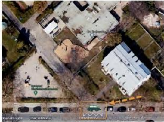
Abbildung 2: Schematische Darstellung der Falschparker

Ein mögliche Kennzeichnung könnte durch eine explizite Parkverbotsschilderung erfolgen. Idee: