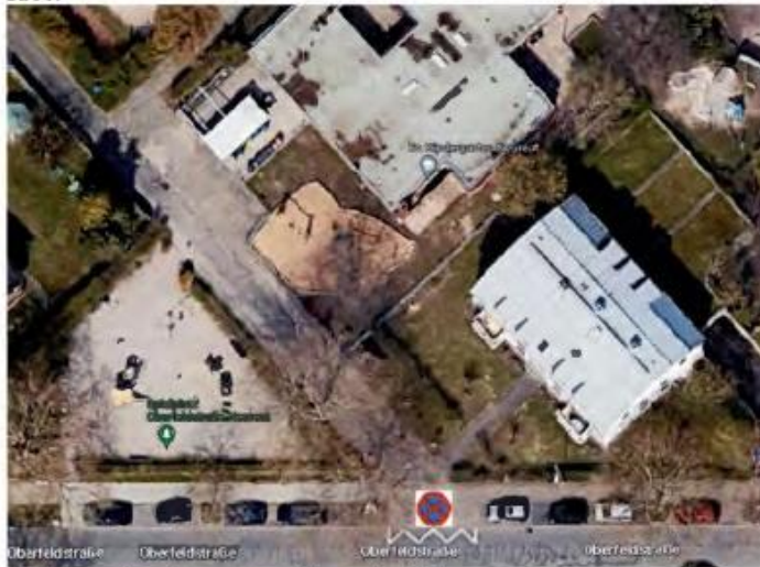
Abbildung 3: Vorschlag zur Kennzeichnung der Fläche

Ein mögliche Kennzeichnung könnte durch eine explizite Parkverbotsschilderung erfolgen. Idee: