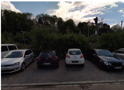
Eisenbahnstraße Höhe Hausnummer 40