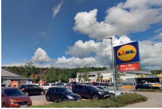
Parkplatz der Einkaufsmärkte LIDL und Edeka in der Niddastraße 8 und 6