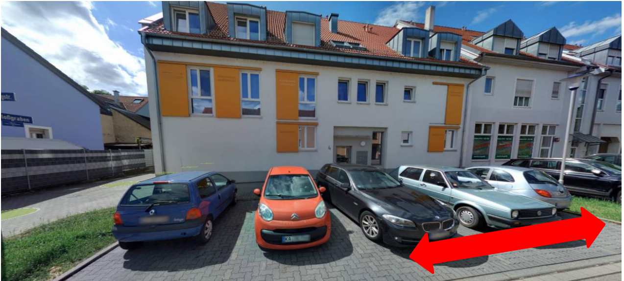
Abbildung 2: Ansicht aller Stellflächen vor dem Anwesen Büchelbergstraße 4