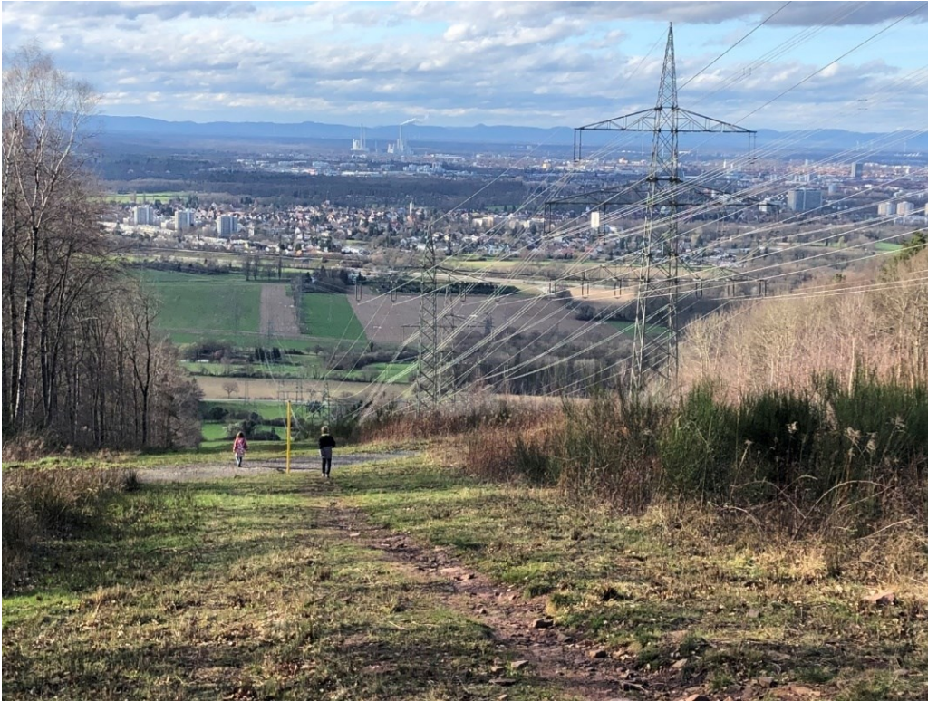
Blick von hinter dem Wildscheingehege Grünwettersbach (höchster Punkt von Karlsruhe) auf Karlsruhe.