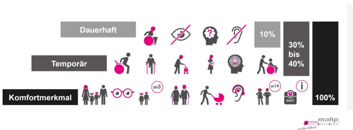
Abbildung 1: Bedeutung von Barrierefreiheit; Quelle: © mahp-barrierefrei

An dieser Stelle wird darauf hingewiesen, dass durch §8 Abs. 3 im PBefG nur die Buslinienverkehre und Straßenbahnverkehre (Schienenverkehre nach BoStrab) und nicht die Eisenbahnverkehre erfasst werden, und daher im Rahmen dieser Ergänzung des Nahverkehrsplans nur auf diese näher eingegangen werden kann. Für Eisenbahnverkehre gelten abweichende Vorgaben und Regelungen.