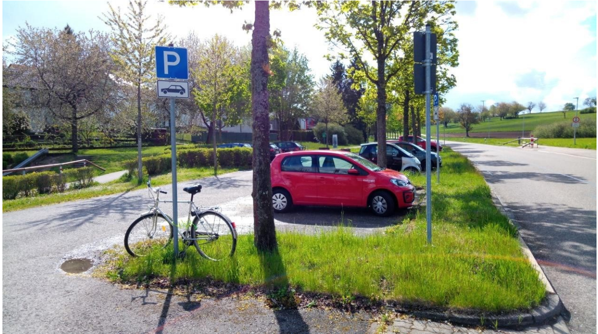
Abbildung 1 Fahrräder werden derzeit ungeordnet im Gelände abgestellt