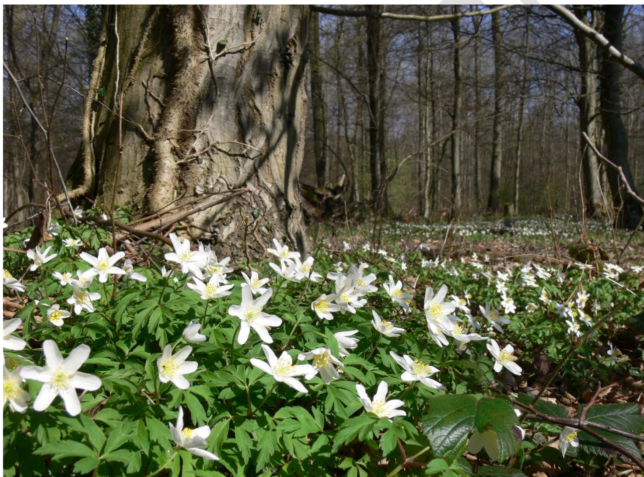
Abbildung 5: Ein Teppich aus Buschwindröschen: Frühling im Wald.

Sowohl in Hinblick auf das Einbringen neuer Baumarten, beispielsweise solche mit höherer Trockenheitstoleranz, als auch im Umgang mit invasiven Arten besteht ein Konfliktfeld in der Frage, wie zukünftig das Verhältnis von heimischen Waldbäumen und nicht-heimischen Baumarten sein soll. Hierbei spielen Belange des Naturschutzes, der Ökologie und der Artenvielfalt, aber auch ökonomische Überlegungen eine Rolle.