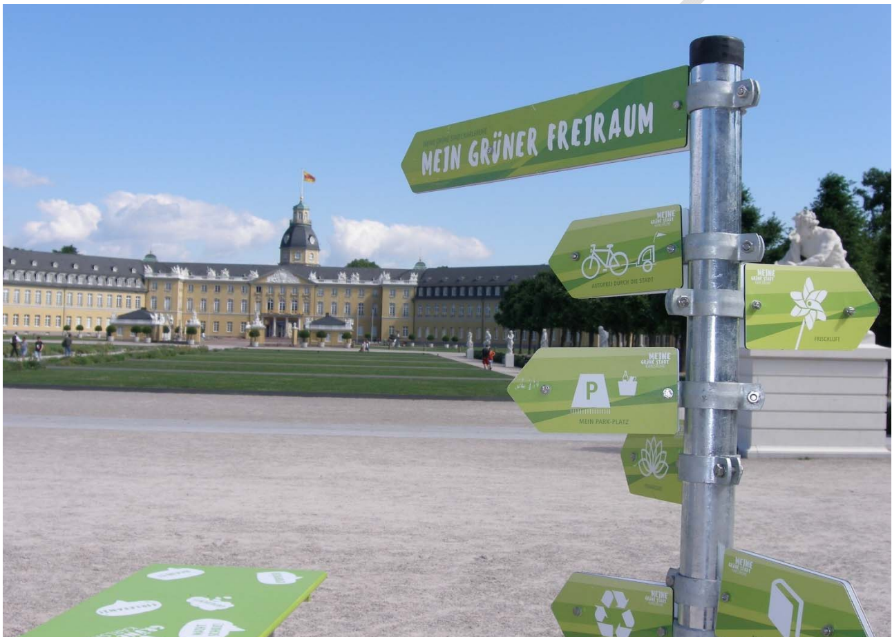
Abbildung 2: Grüne Stadt Karlsruhe.

Aufgrund der Vielzahl der Handlungsfelder im Bereich der Klimaanpassung sind für die Stadt Karlsruhe die Vernetzung und der Austausch unabdingbar: innerhalb der Stadtverwaltung, mit dem Wissenschaftsbereich, mit Verwaltungen anderer Städte und übergeordneten Behörden, mit der Stadtpolitik und mit engagierten Personen aus der Karlsruher Bürgerschaft.