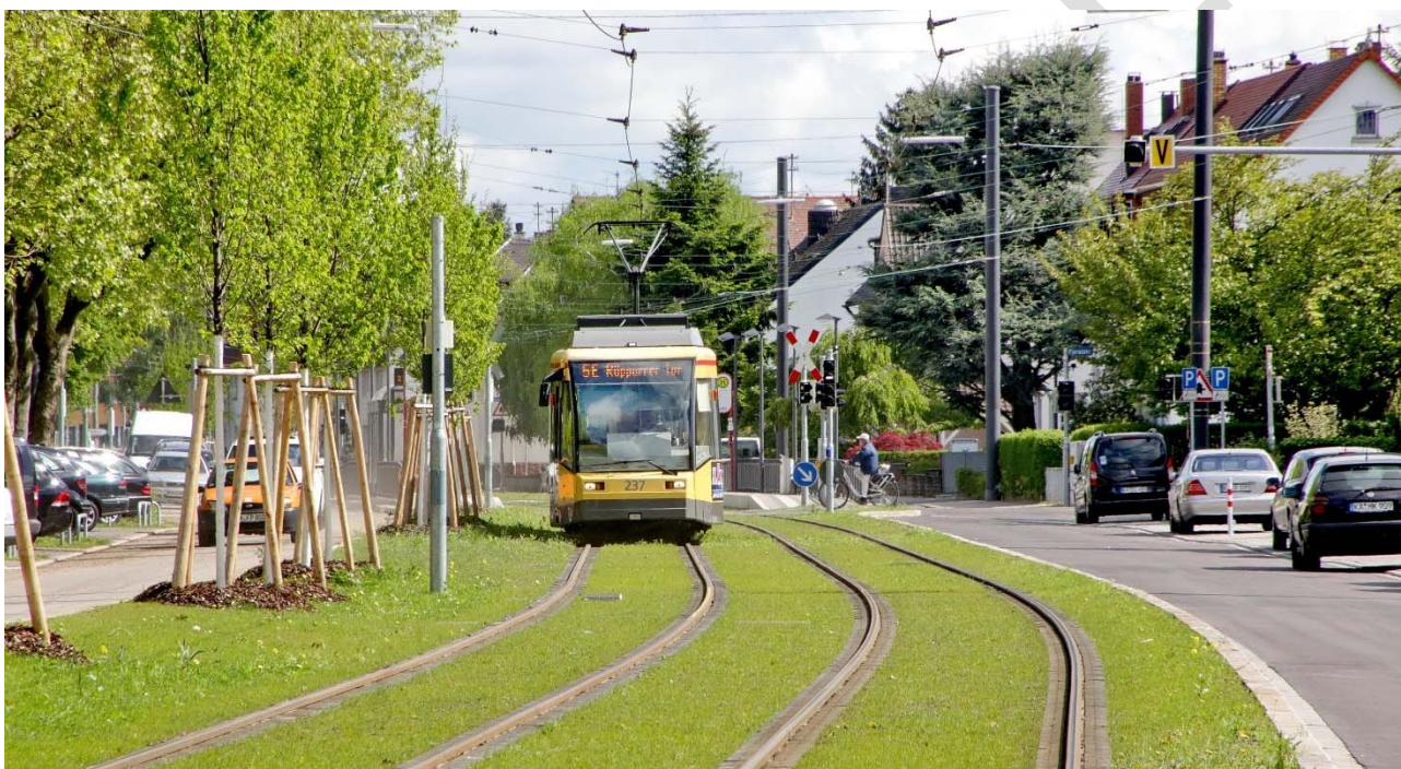
Abbildung 15: Rasengleis in der Mannheimer Straße.

Hoch- und Niedrigwasserereignisse am Rhein, die durch die Niederschlagsverhältnisse in den Alpen bestimmt werden, können die Schifffahrt und den Rheinhafen Karlsruhe beeinträchtigen. Der Schutz gegen Hochwasser wird durch das Hochwassersperstor gewährleistet.