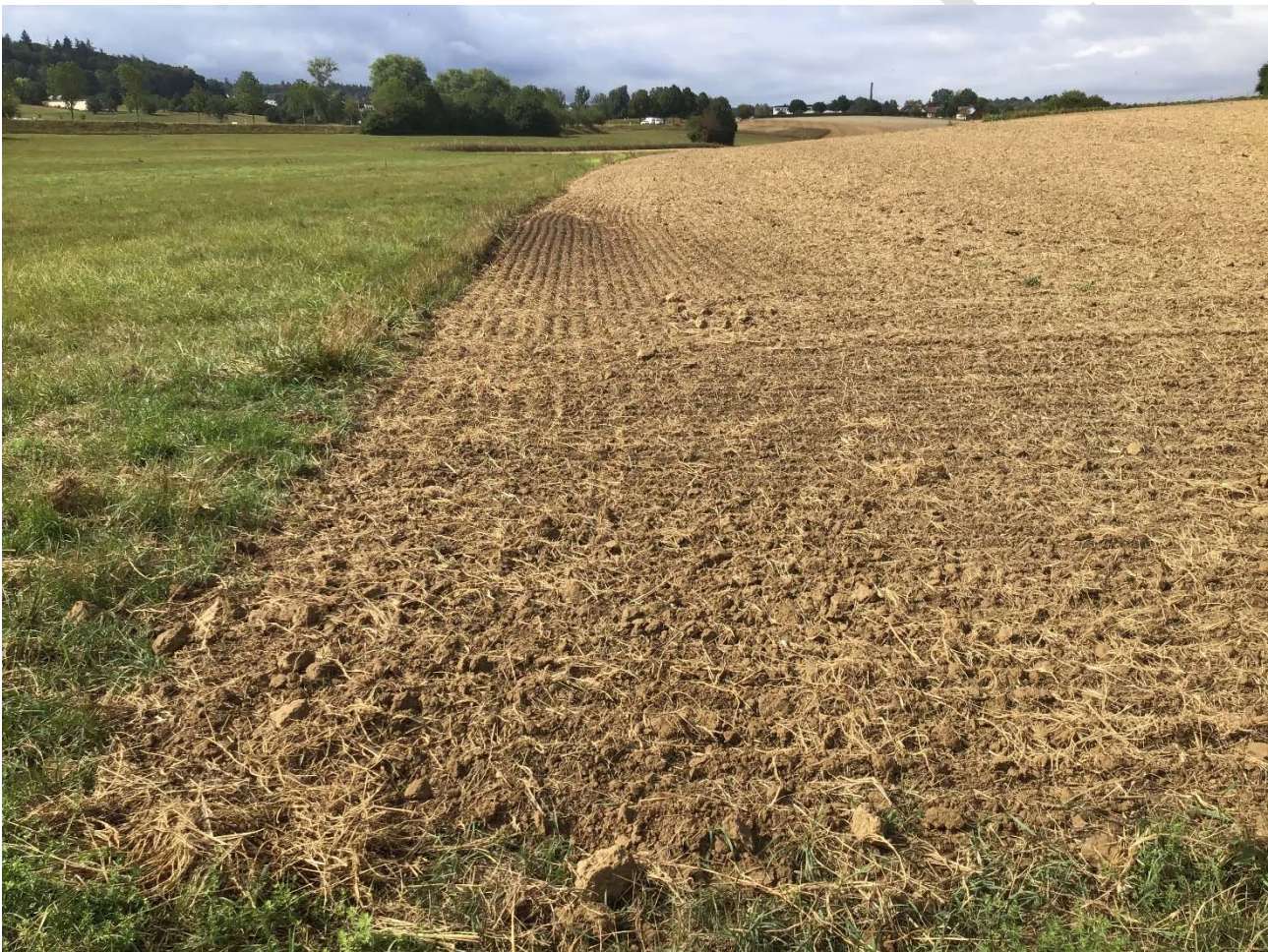
Abbildung 6: Multitalent Boden.

Langanhaltende Trockenheit und Hitze und plötzliche Starkregenereignisse: Den Böden sind die Auswirkungen des Klimawandels an der Oberfläche anzusehen. Die Auswirkungen von hohen Temperaturen und fehlenden Niederschlägen reichen auch tiefer in den Boden hinein und sind sehr vielschichtig. Mit den Veränderungen des Bodenwasserhaushalts und der Bodentemperatur werden die bodenbildenden und bodenentstehenden Prozesse verändert. Über den Schutz der Böden können diese Leistungen für das Ökosystem nachhaltig geschützt werden und die Böden in ihrem natürlichen Vorkommen erhalten bleiben. Innerhalb der Stadt können durch die Herstellung oder den Erhalt einer funktionsfähigen Bodenschicht in Parks und Grünanlagen die Fähigkeiten der Böden genutzt werden. Außerhalb der Stadt spielt auf den landwirtschaftlichen Flächen die Bodenbewirtschaftung eine große Rolle. Die Maßnahmen zur Klimaanpassung haben die Ziele, den Boden vor Versiegelung und Verdichtung sowie vor Veränderungen wie Humusabbau und Erosion zu schützen.