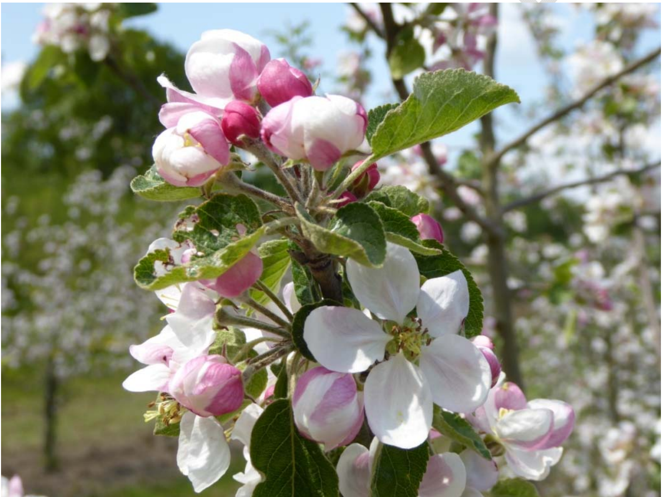
Abbildung 4: Frühlingspracht im Obstbau.

Im Gegensatz zu anderen Sektoren kann die Landwirtschaft im Rahmen der Anbaustrategie auch relativ kurzfristig und flexibel auf Klimaänderungen reagieren. Um die Herausforderungen des anthropogenen Klimawandels zu bewältigen, müssen allerdings die pflanzenbaulichen Strategien proaktiv weiterentwickelt werden. Neben Anstrengungen in der Pflanzenzüchtung und Neuerungen im Sortenspektrum betrifft dies Anpassungen bei Aussatterminen, Fruchtfolge und Sortenauswahl, Düngung, Bodenbearbeitung, Pflanzenschutz und beim Bewässerungsmanagement.