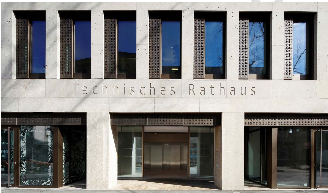
Abbildung 8: Lüftungskappen am Technischen Rathaus Karlsruhe zur Unterstützung der Nachtauskühlung.

Die Auswirkungen des Klimawandels auf Gebäude müssen beim Wohnungsneubau berücksichtigt werden, vor allem ist allerdings im Wohnungsbestand eine Anpassung notwendig. Denn hohe Temperaturen heizen nicht nur die Gebäudehülle auf, sondern auch das Gebäudeinnere. Sie beeinflussen damit Wohnkomfort und Wärmebelastung der Bewohnerinnen und Bewohner sowie in Bürogebäuden die Arbeitsproduktivität. Konventionelle Klimaanlage zur Abkühlung stehen wegen des notwendigen Energiebedarfs allerdings in Konflikt mit den Klimaschutzziele. In städtischen Gebäuden werden zur Kühlung stattdessen intelligente Lüftungssysteme eingesetzt, die an den Witterungsverlauf angepasst das Öffnen und Schließen der Gebäudeöffnungen steuern. Maßnahmen zur Wärmedämmung haben hingegen einen gleich doppelten positiven Effekt. Mit Blick auf den Klimaschutz reduzieren sie Wärmeverluste im Winter und verringern so den CO 2 -Ausstoß zur Gebäudebeheizung. Mit Blick auf die Klimaanpassung verbessern sie gleichzeitig auch den Wärmeschutz im Sommer und schützen die Räume vor Aufheizung bei Hitzeperioden.