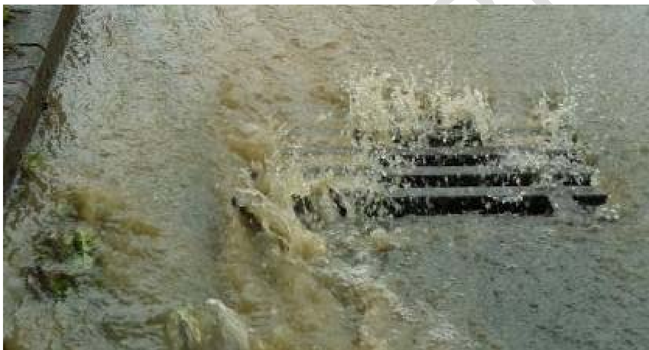
Abbildung 13: Niederschlagsmengen im Zulauf zur Kanalisation.

Im Hinblick auf die Veränderungen, die mit dem Klimawandel einhergehen, stellt für die Stadtentwässerung der Umgang mit extremen Starkregenereignissen die größte Herausforderung dar. Ein zentraler Ansatz für die Klimaanpassung ist es, die Überflutungsvorsorge und Regenwasserretention systematisch in neue Planungen einzubringen, um die Überflutungsgefahr im bebauten Gebiet auf ein tolerierbares Maß zu reduzieren. Bei Straßenumbaumaßnahmen wird die Straße als temporärer Retentionsraum mit Speicherraum in der Fläche gestaltet. In Neubaugebieten ist die Zielsetzung, Flächen nur dort zu versiegeln, wo es unbedingt erforderlich ist, multifunktionale Bereiche zu schaffen und anfallendes Niederschlagswasser möglichst vor Ort zu versickern. Ebenso müssen – zur Schadensbegrenzung bei außergewöhnlichen Extremereignissen – verstärkt Maßnahmen zum privaten Objektschutz ergriffen werden, wozu betroffene Bürgerinnen und Bürger informiert werden.