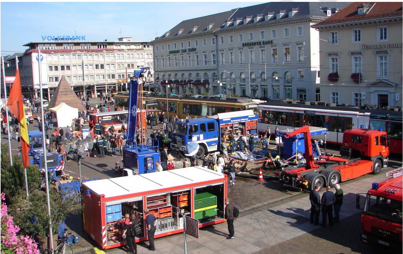
Abbildung 17: „Tag des Katastrophenschutzes“ auf dem Karlsruher Marktplatz.

Ergänzend informiert die Branddirektion in ihrer Öffentlichkeitsarbeit die Bevölkerung regelmäßig über Vorsorge- und Selbstschutzmaßnahmen zur Stärkung der eigenen Resilienz, beispielsweise beim Tag der offenen Tür der Berufsfeuerwehr oder beim „Tag des Katastrophenschutzes“.