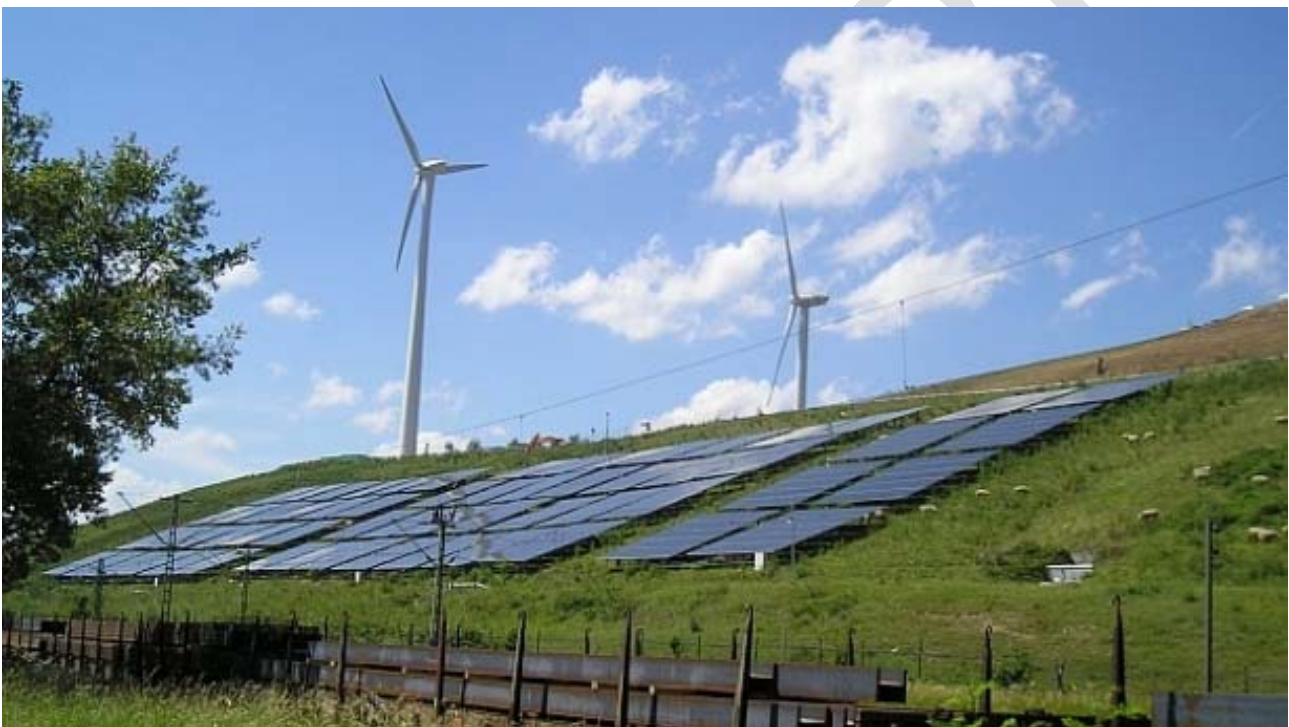
Abbildung 14: Photovoltaik-Freiflächenanlage und Windkraftanlagen auf dem Karlsruher „Energieberg“.

Zum anderen werden sich vor allem veränderte Temperaturverhältnisse saisonal unterschiedlich auf die Nachfrage auswirken. Höhere Temperaturen im Winter und gesetzliche Vorgaben zur Energieeinsparung bei Gebäuden senken den Heizbedarf. Höhere Temperaturen im Sommer erhöhen die Nachfrage nach Kühlung und Klimatisierung. Vor allem die Erzeugung von Strom aus alternativen und regenerativen Energien, die einen Beitrag zum Klimaschutz leisten, tragen damit auch zur Klimaanpassung bei. Denn sie decken den zunehmenden Bedarf an Strom und bremsen die dadurch verursachten Lastspitzen.