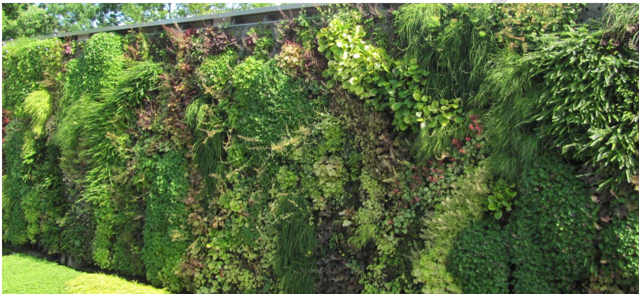
Abbildung 9: Fassadenbegrünung am Elefantenhaus des Zoos.

Das Stadtgrün muss in Bezug auf die Klimaanpassung von zwei Seiten betrachtet werden: Grünflächen sorgen für kühle Inseln innerhalb wärmerer Bebauung. Auch Grün auf Dächern, an Fassaden und im Gebäudeumfeld wirkt ausgleichend auf die Temperatur und Stadtbäume bieten Schatten an heißen Sommertagen. Allerdings leiden die Grünflächen erkennbar unter Trockenheit und hohen Temperaturen, wie sie in den Sommern 2018 und 2019 auftraten. Stadtbäume sind dabei zusätzlich durch wenig Wurzelraum, Bodenverdichtung und Beschädigungen besonderem Stress ausgesetzt. Um die wertvollen Funktionen für das Stadtklima und das Wohlbefinden zu erhalten, gibt es zahlreiche Ansätze. Dazu zählen Pflanzungen von Baumarten, die für das Stadtklima geeignet sind, Optimierungen im Ressourcenmanagement, verstärkter Einsatz von innovativen, technischen Lösungen im Bestandsgrün sowie stadtplanerische Instrumente.