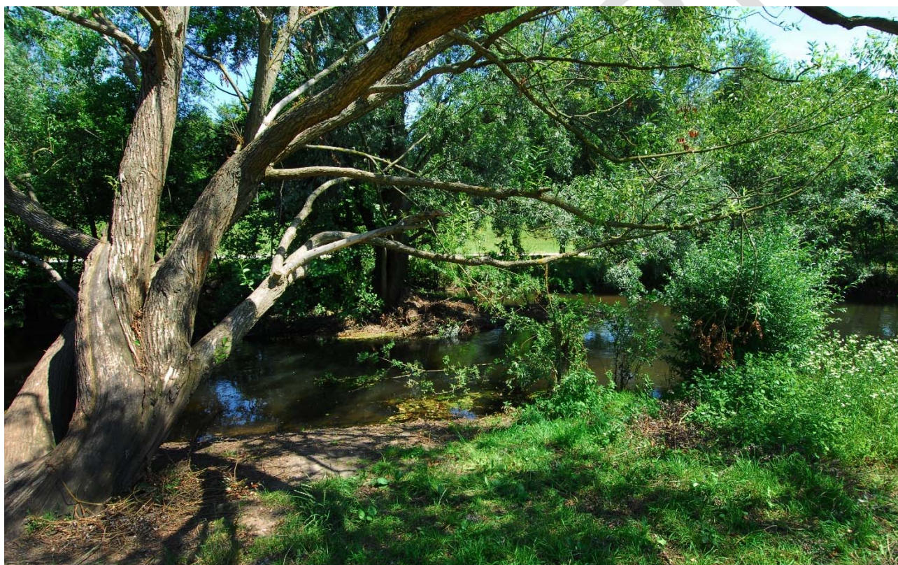
Abbildung 11: Die Alb.

Der Hochwasserschutz ist bereits seit vielen Jahrzehnten gesetzlich verankert und eine Pflichtaufgabe für die Kommunen. Auf der Grundlage der Wasserrahmenrichtlinie sowie der Hochwasserrisikomanagementrichtlinie werden auch in Karlsruhe viele Maßnahmen umgesetzt. Der Hochwasserschutz und der Erhalt der ökologischen Funktion der Gewässer brauchen jedoch nicht nur eine entsprechende finanzielle Ausstattung, sondern vor allem auch Flächen. Gerade die Flächenverfügbarkeit stellt sich in einer Großstadt wie Karlsruhe als immer größer werdendes Problem heraus.