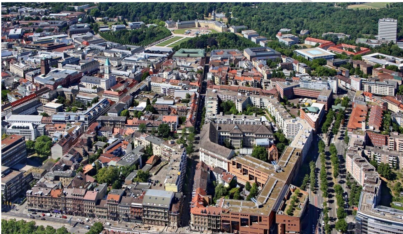
Abbildung 7: Blockrandbebauung in der Karlsruher Innenstadt.

Karlsruhe ist eine wachsende Stadt. Die große Herausforderung besteht darin, einerseits mehr Wohnraum und Arbeitsstätten durch Nachverdichtung zu schaffen, und andererseits Grünflächen nachhaltig zu erhalten oder neu zu schaffen. Es ist ein Hauptanliegen des Handlungsfelds „Stadtplanung und Städtebau“, die städtebaulichen Strukturen in ihrer Gesamtheit und ihrem Wirkungsgefüge der Einzelmaßnahmen untereinander zu betrachten, zu sichern, klimaoptimiert auszugestalten und weiterzuentwickeln. Wichtig ist dabei, die Elemente zur Klimaanpassung so früh wie möglich in Planungen und Konzepte einzubringen und systematisch zu berücksichtigen. Dazu gehören beispielsweise eine Gebäudestellung, die auch bei neuer Bebauung eine Durchlüftung des neuen und der angrenzenden Gebiete erlaubt, die Begrünung von Dächern, Fassaden und Freiflächen, die Versickerung und Zwischenspeicherung von Regenwasser und die Sicherstellung einer angenehmen Aufenthaltsqualität in den Gebäuden und in den Freiräumen durch effiziente Grünordnung.