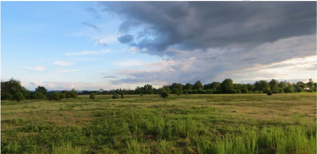
Abbildung 10: Naturschutzgebiet „Alter Flugplatz Karlsruhe“.

Das Bundesnaturschutzgesetz schreibt die dauerhafte Sicherung und Förderung der Biologischen Vielfalt vor. Höhere Temperaturen und Niederschlagsänderungen haben sowohl auf einzelne Arten als auch auf Ökosysteme und Lebensräume vielfältige Auswirkungen. Handlungsbedarf entsteht zum einen durch Veränderungen für geschützte Arten, zum anderen durch die Ausbreitung invasiver Arten. Die bisherigen und zukünftigen Maßnahmenswerpunkte zur Klimaanpassung liegen in den Themenfeldern Flächenschutz und Optimierung der Flächenpflege. Eine weitere Konkretisierung wird das in Arbeit befindliche Biodiversitätskonzept der Stadt Karlsruhe leisten. Darin wird auch der Klimawandel berücksichtigt, soweit sein Einfluss bereits abschätzbar ist.