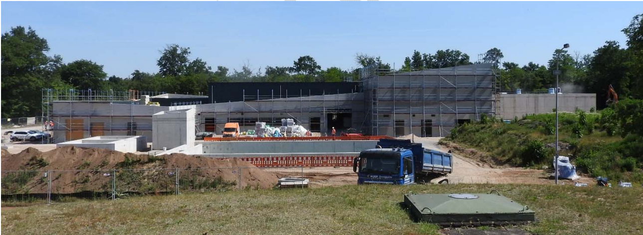
Abbildung 12: Baustelle des Wasserwerks Mörscher Wald.

Zur Bereitstellung von Trinkwasser an heißen Tagen für die Öffentlichkeit eignen sich in Karlsruhe 31 öffentliche Brunnen als Trinkbrunnen. Daneben gibt es in Karlsruhe derzeit sieben Trinkwasserspender in öffentlichen Gebäuden. Sowohl die Trinkwasserspender in den öffentlichen Gebäuden sowie die Brunnen, die sich zum Trinken bzw. Befüllen von Trinkflaschen eignen, sind in der Trinkwasser-App („Trinkwasser Karlsruhe“) der Stadtwerke Karlsruhe aufgeführt.