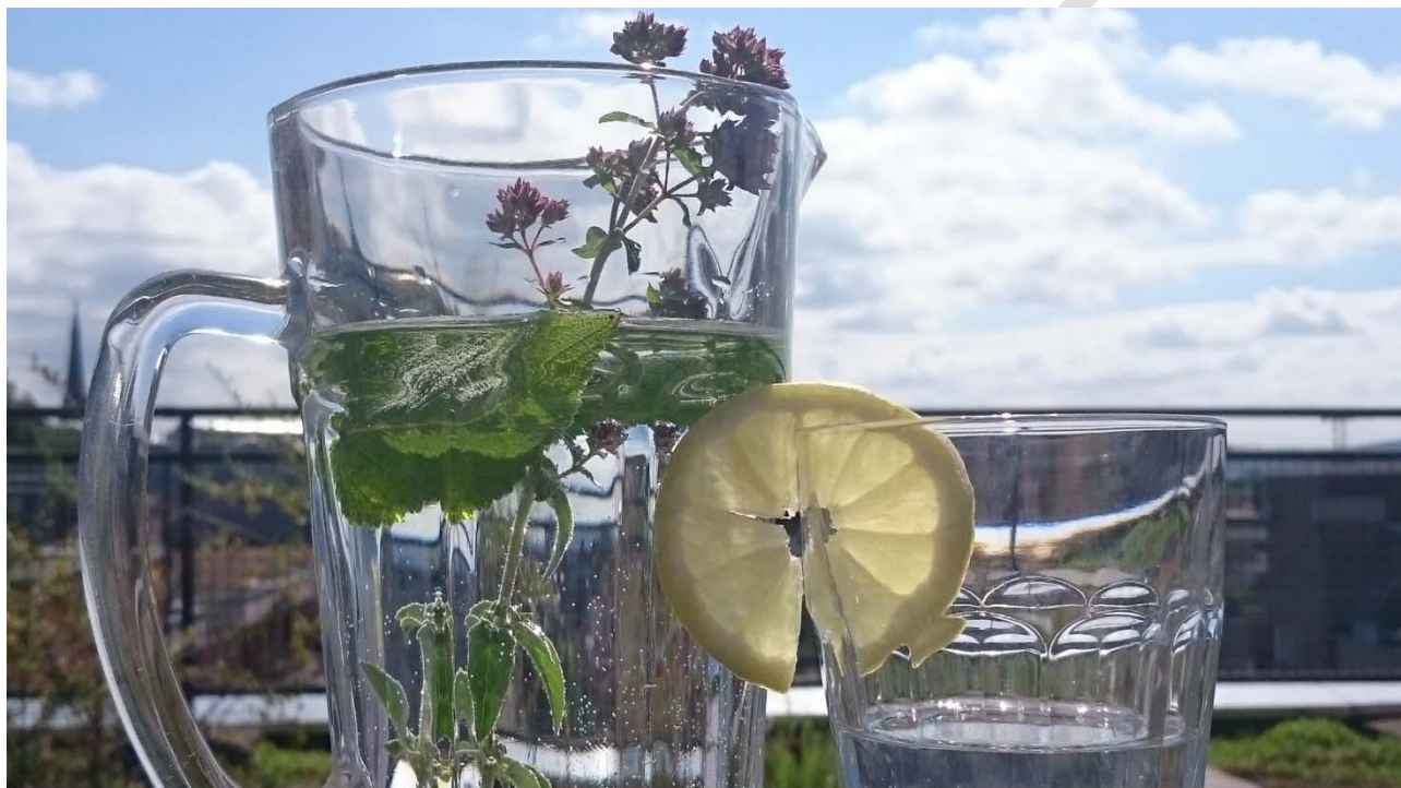
Abbildung 3: Karlsruher Trinkwasser bewahrt vor Belastung durch Hitze.

Einen weiteren Handlungsschwerpunkt stellt die Bekämpfung von Tieren und Pflanzen dar, die die Gesundheit gefährden können. Dazu zählen beispielsweise die Ambrosie als allergieauslösende Pflanze und die Tigermücke als potentieller Überträger von eigentlich in den Tropen heimischen Viren.