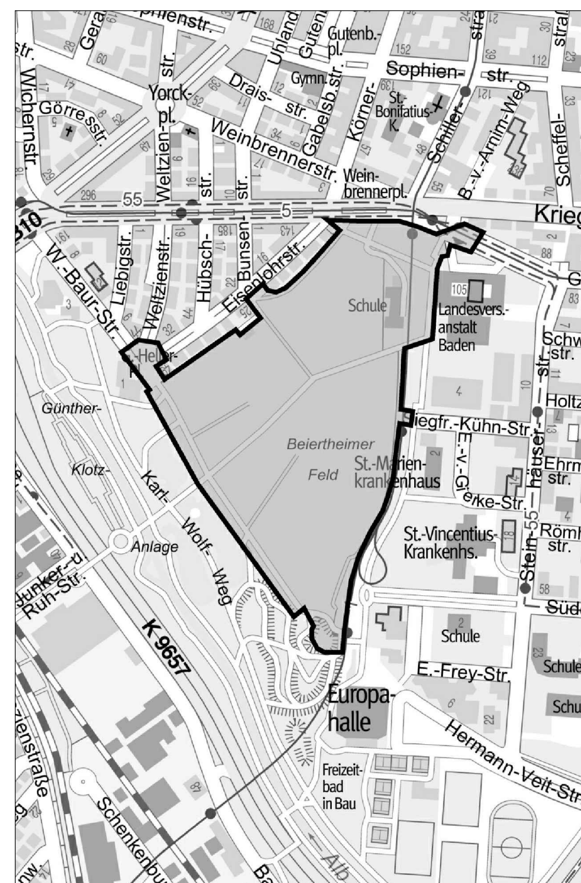
Ausschnitt Stadtplan M: 1:10000