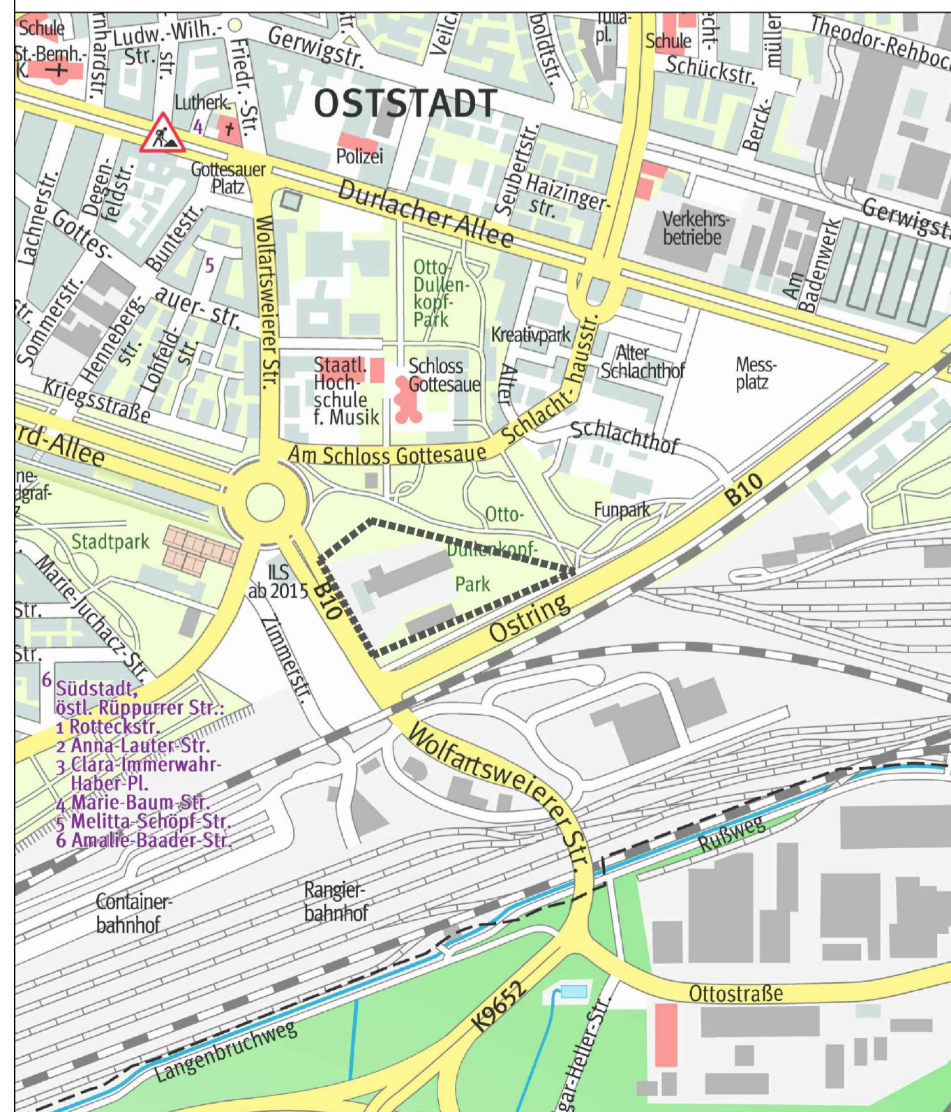
Stadtplanausschnitt 1 : 10.000

Kartengrundlage: Liegenschaftsamt Stand: 09.08.2016