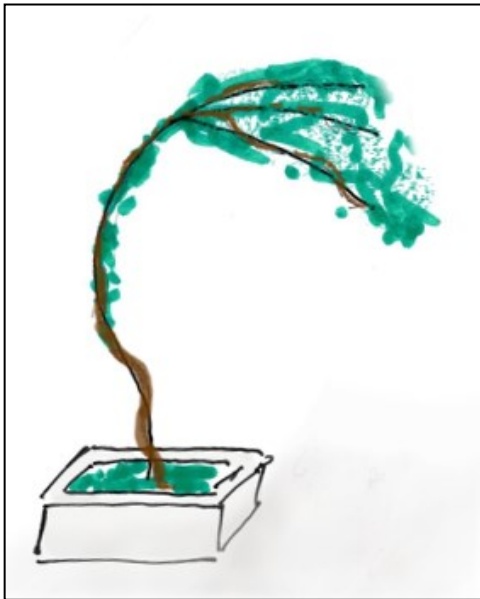
1 Halbbeschattung durch bewachsenes Gestell (Beispielzeichnung)