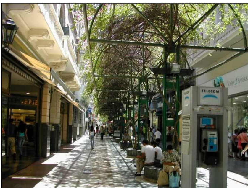
3 Beschattung durch Lauben (Córdoba)