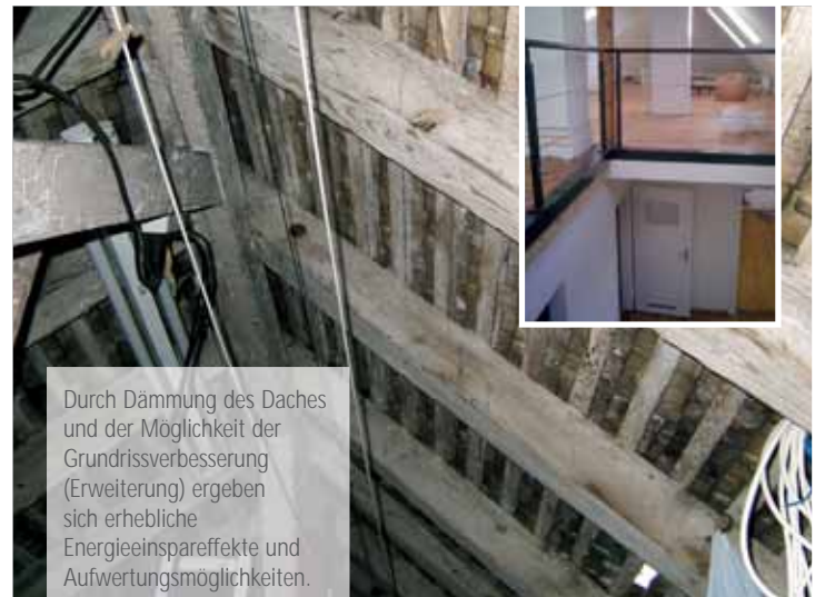
Durch Dämmung des Daches und der Möglichkeit der Grundrissverbesserung (Erweiterung) ergeben sich erhebliche Energieeinspareffekte und Aufwertungsmöglichkeiten.