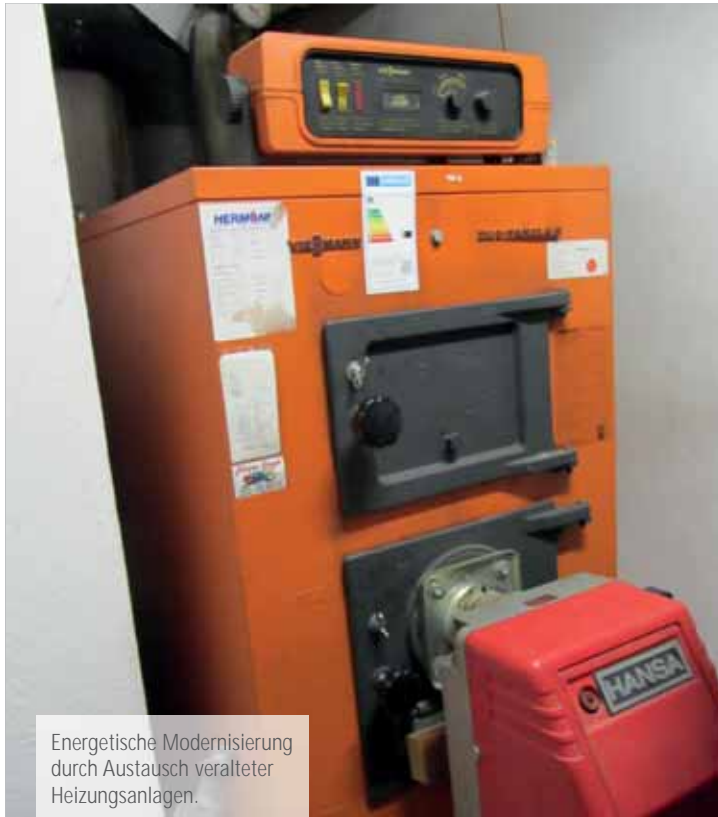
Energetische Modernisierung durch Austausch veralteter Heizungsanlagen.