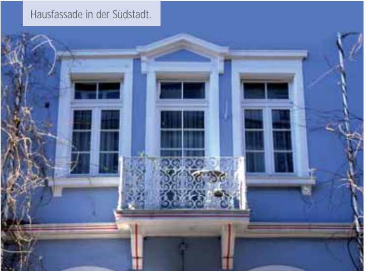
Hausfassade in der Südstadt.

Telefon: 0721 133-6101 Fax: 0721 133-6109 E-Mail: stpla@karlsruhe.de Internet: www.karlsruhe.de/b3/bauen/sanierung