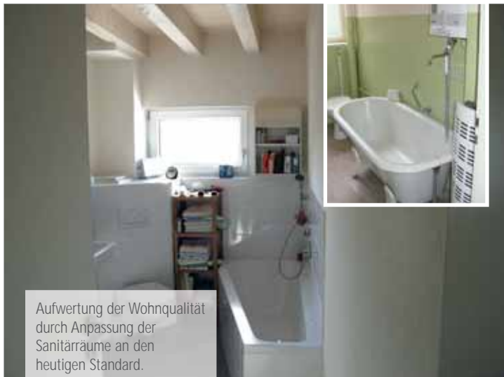
Aufwertung der Wohnqualität durch Anpassung der Sanitärräume an den heutigen Standard.

Dies gilt nicht für den Erhalt zinsverbilligter Kredite (zum Beispiel KfW-Darlehensmittel).