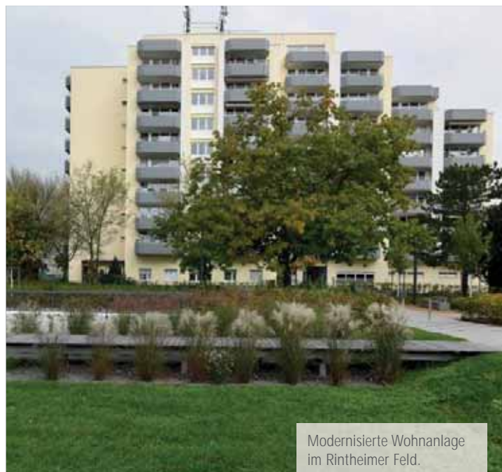
Modernisierte Wohnanlage im Rintheimer Feld.

Falls solche Arbeiten aber als Folgearbeit einer Modernisierung anfallen, können diese gefördert werden (Beispiel: Fliesen-, Gips-/Malerarbeiten bei Einbau, Erneuerung eines Bades/einer Toilette).