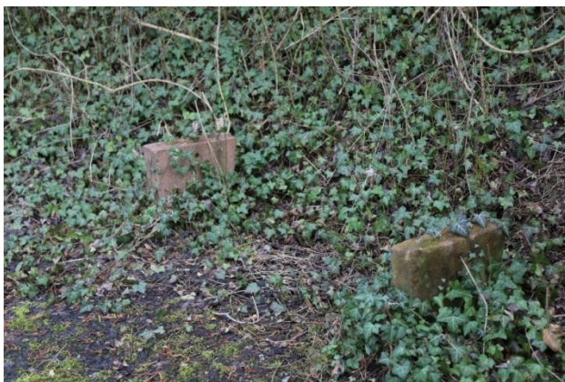
Reste einer Bank am Hirschhälldenweg