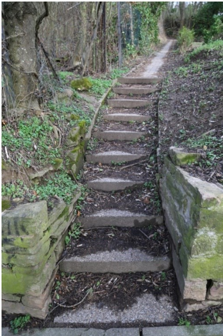
Verbindung alter Hälldenweg und Hirschhälldenweg