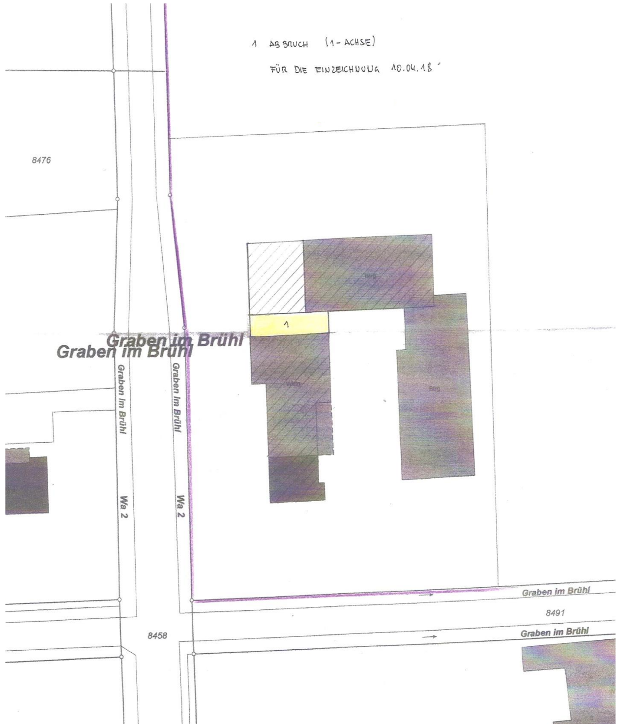
Lageplan mit vorhandener Bebauung