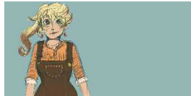
(Zeichnung: C. Kasper)