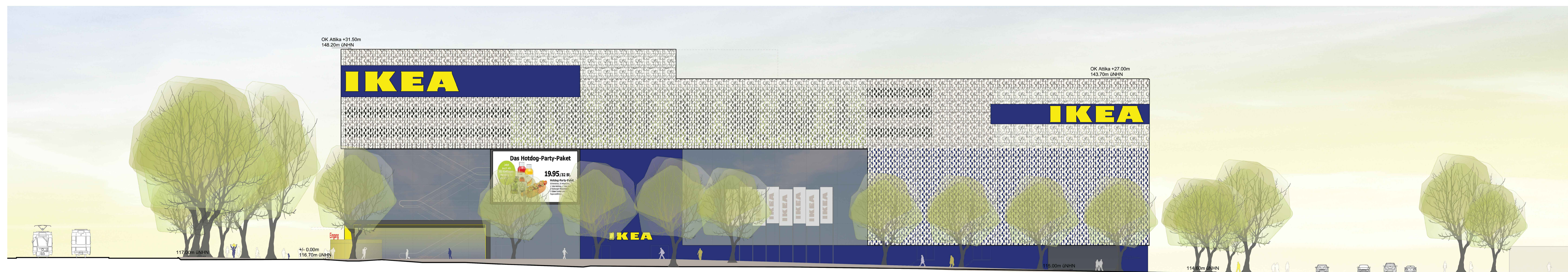
ANSICHT OSTEN // 1:200