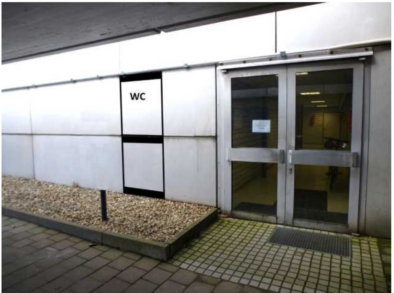
Eingangstür zum WC