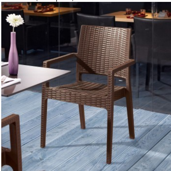
Stuhl mit Lehne