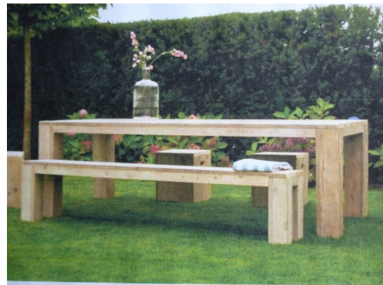
Stammtisch mit Bänken ( Beispiel )