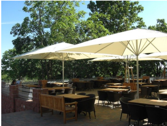
Schirme ( Beispiel )