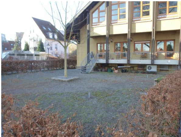
Ansicht Biergarten von Osten, jetziger Zustand