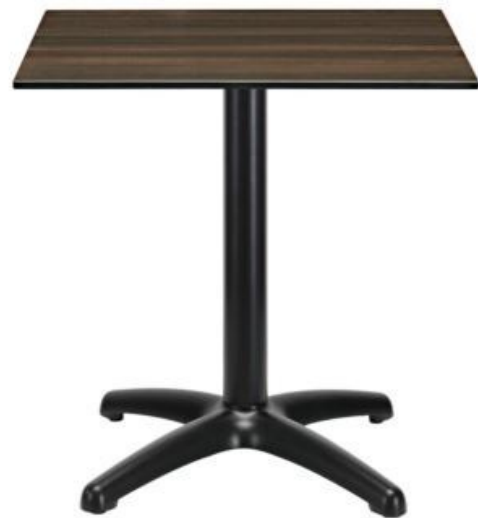
Tisch mit Alufuss schwarz