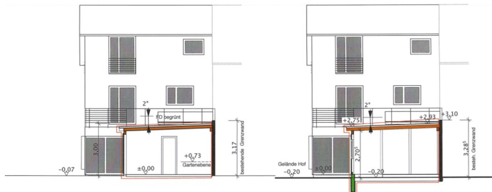
Schnitt C 3