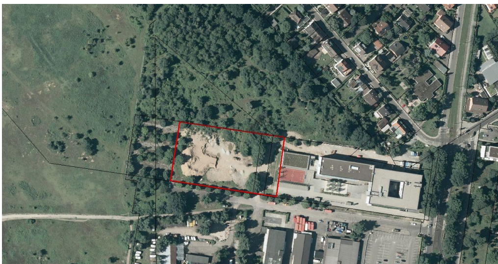
Abbildung 1: Westerweiterung - engerer Untersuchungsraum des Planungsgebiets

Der engere Untersuchungsraum umfasst den für eine zusätzliche Bebauung zur Verfügung stehende Westteil des Planungsgebiets von 7.510 m 2 . Er wird im Folgenden mit „Westerweiterung“ bezeichnet.